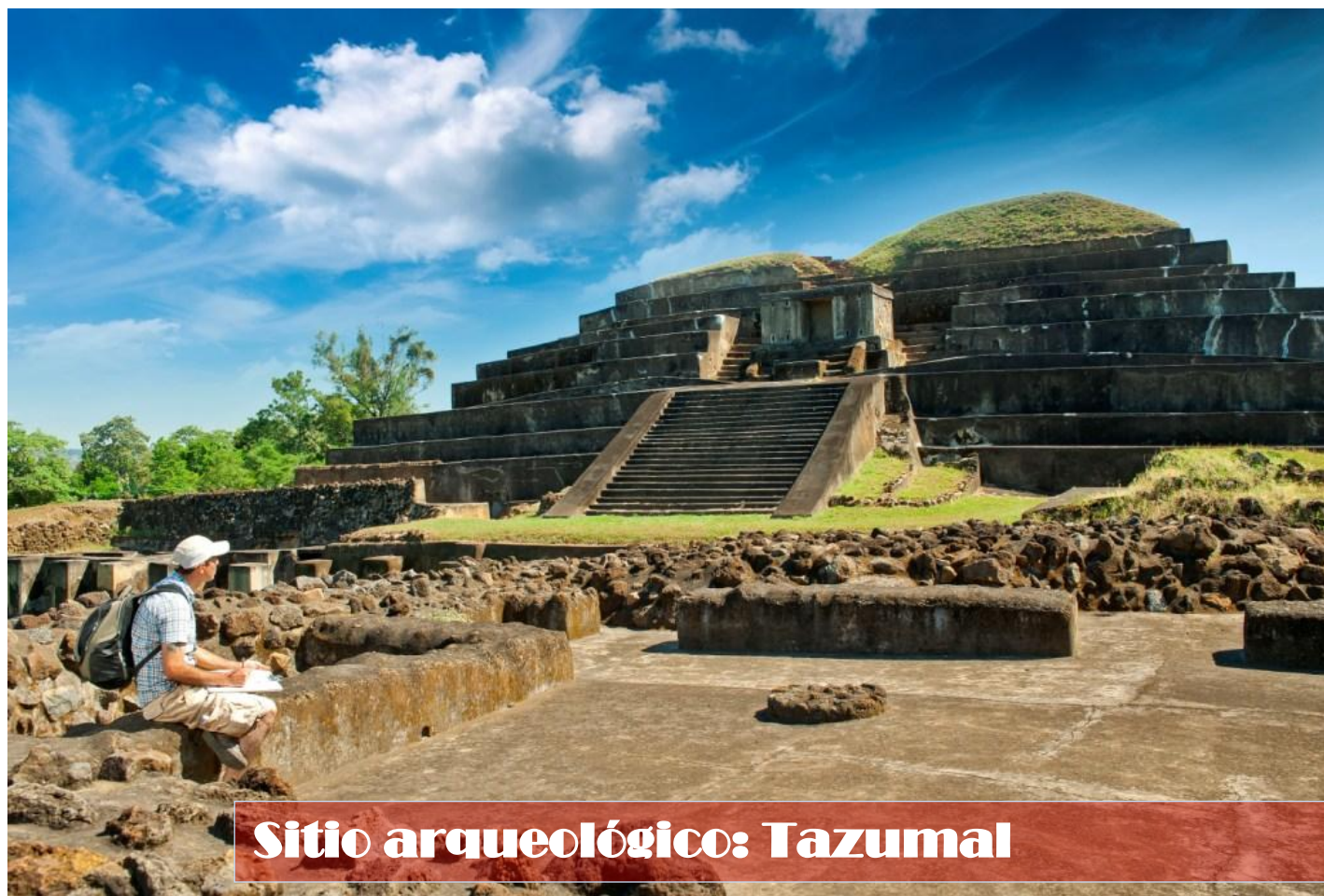
Sitio arqueológico: Tazumal

Embajada de El Salvador en Alemania: Joachim-Karnatz-Allee 47, 10557 Berlín. Tel. +49 (0)30 206 4660 | Fax +49 (0)30 206 46629 Correo electrónico: embasal@embasalva.de Sitio web: embajadaalemania.rree.gob.sv Facebook: Embajada de El Salvador en Alemania