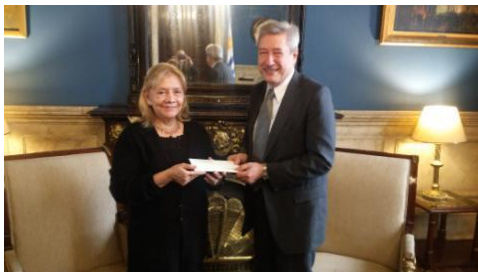
Embajadora Menjívar recibe Beneplácito de Estilo para designación de nuevo Embajador.

Embajadora agradeció a Embajador Bouzout todas las facilidades y atenciones que recibió del Gobierno uruguayo durante su gestión al frente de la Misión Diplomática.