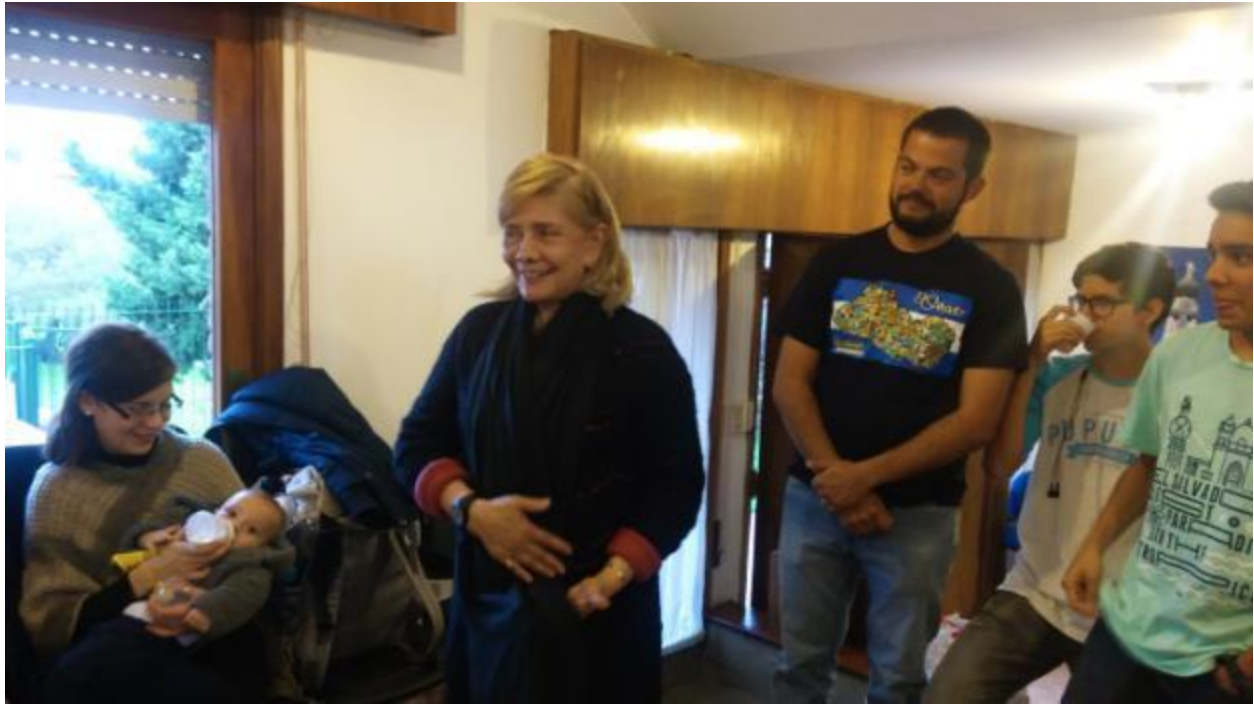
Embajadora Menjívar dirigiendo unas palabras de alusivas al día de la Madre y del Padre.