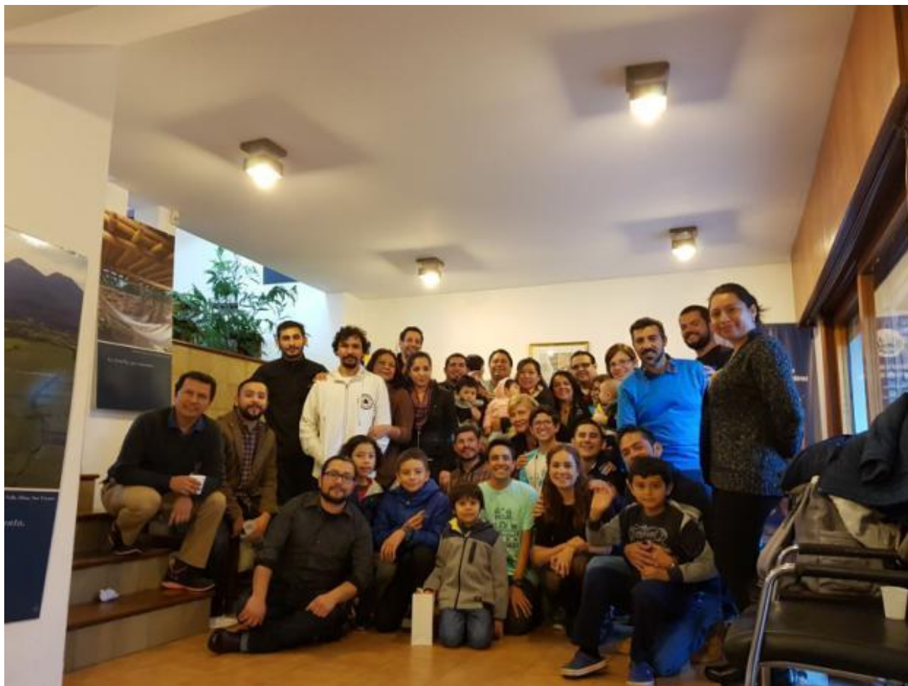
Foto de Familia en la Sede de la RDC.