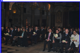
Aspecto general de la nutrida asistencia a la Eucaristía