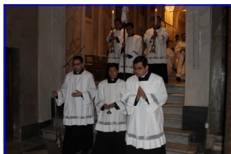
Ingreso de la procesión Eucarística

Finalmente y para cerrar con broche de oro el programa de actividades conmemorativas, se ofreció por parte de ambas Embajadas, una muy significativa Eucaristía en la Basílica de San Bartolomeo all'Isola, sitio memorial dedicado por el Papa Benedicto XVI a los mártires del Siglo XX y en cual se custodian como reliquias el Misal que utilizaba Monseñor Romero el día de su cobarde asesinato y a partir de hoy, sus ornamentos litúrgicos, los cuales fueron traídos recientemente por el postulador de la causa después de su viaje a nuestro País.