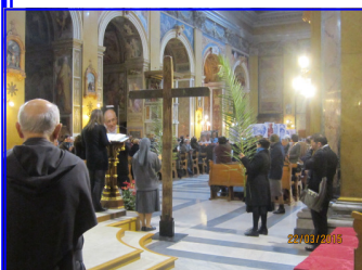
Asamblea de fieles en la Eucaristía de Santa Maria in Traspontina