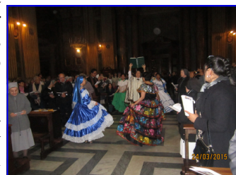
Ingreso de la palabra de Dios a la celebración de la vigilia en medio de cantos y danzas tradicionales