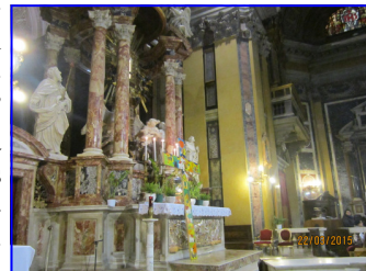
Altar de Santa Maria in Traspontina lugar de la celebración eucarística del Comité Romano Oscar Romero