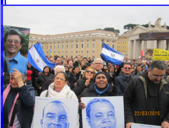
El emotivo momento del mensaje de Papa Francisco a los participantes