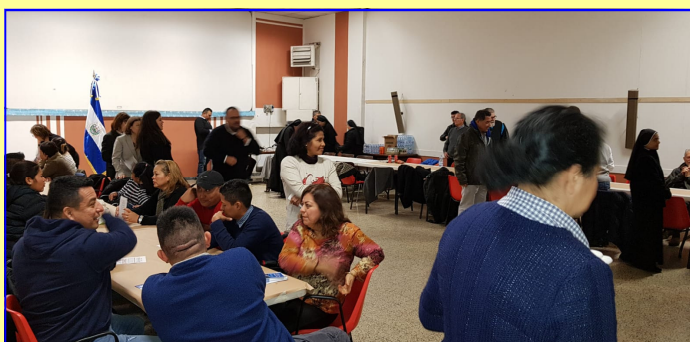
Aspecto general del convivio ofrecido por las Embajadas a la comunidad salvadoreña residente en Roma

Posteriormente se desarrolló un convivio en el cual se disfrutaron los tra-