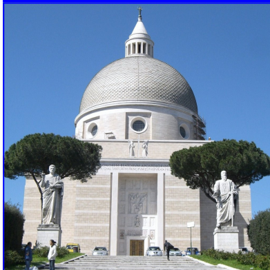
Exterior de la Basílica de los santos Pedro y Pablo

El domingo 25 de noviembre las embajadas de El Salvador ante Italia y ante la Santa Sede, celebraron de forma conjunta las efemérides del “Día de la Virgen de la Paz” y el Día de los Salvadoreños en el Exterior.