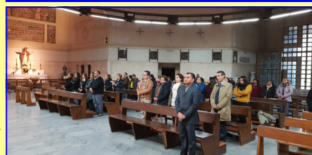
Aspecto general de la concurrencia