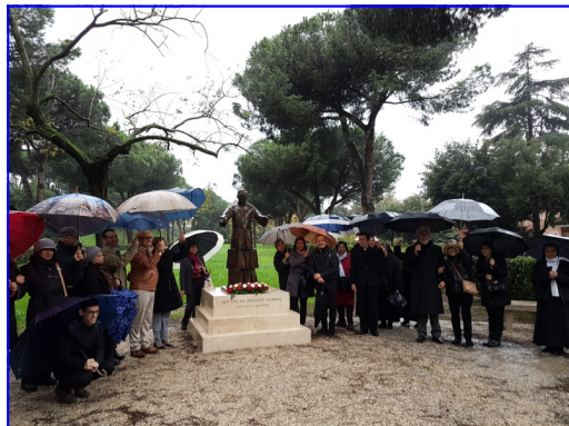
Vista general del momento de colocación de la ofrenda floral a San Oscar Romero, Obispo y Mártir

Después de la celebración Eucarística, a pesar de la intensa lluvia, se procedió a realizar una procesión hacia el monumento de San Oscar Romero, para depositarle la ofrenda floral que estuvo a los pies de la imagen de Nuestra Señora de la Paz durante la misa.