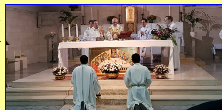
Desarrollo de la celebración Litúrgica

Y al referirse al Día de los Salvadoreños en el Exterior, mencionó la fructífera labor que realizan nuestros connacionales, quienes se han destacado por su laboriosidad, su honradez y han puesto en alto el nombre de El Salvador, como verdaderos embajadores de la cultura, la idiosincrasia y las diferentes tradiciones de nuestro país. Asimismo pidió por las personas migrantes que han dejado el país en busca de oportunidades, solicitando la oración de todos especialmente por los grupos de migrantes irregulares que en la actualidad se dirigen hacia los Estados Unidos, enfrentando muchas dificultades, siendo rechazados y llevando una vida nómada cargada de tantos riesgos en una ruta tan peligrosa como la que están siguiendo.