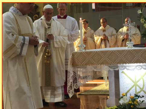
El Papa Francisco al inicio de la ceremonia eucarística, al fondo pueden verse los concelebrantes, Cardenales Tagle, Rosa Chávez y el Vicario de Roma