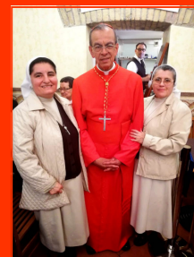
Algunas imágenes del convivio con el Cardenal Rosa Chávez en la Tratoria