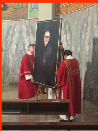
Ceremonia de bendición y entronización de la imagen del Beato Romero