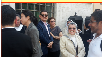
Esperando muy ansiosos la llegada del Cardenal Rosa al lugar del convivio

Después de conocer la fecha de la canonización de nuestro mártir, el Cardenal Rosa Chávez solicitó a nuestra embajada coordinar un encuentro con religiosos, religiosas y algunos miembros de la comunidad salvadoreña residente en Roma a fin de poder celebrar juntos la buena noticia recientemente dada por el Santo Padre.