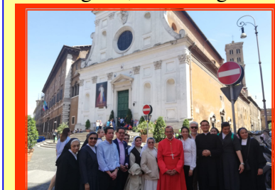
En la Basílica del Santo Spirito in Sassia