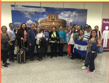
El embajador López recibe al grupo de salvadoreños en el Aeropuerto de Fiumicino

De El Salvador asistió un grupo de 50 personas de diferentes comunidades, los cuales fueron recibidos en el aeropuerto de Roma-Fiumicino por el Embajador de El Salvador ante la Santa Sede, Manuel Roberto López.