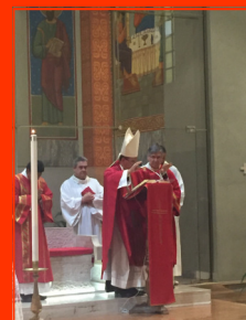
Diferentes imágenes de la celebración eucarística de Pentecostés