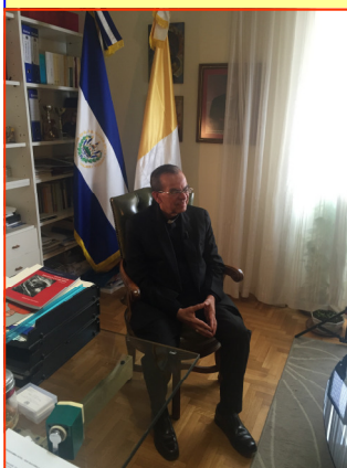
Entrevista realizada por TV2000 al Cardenal Rosa Chávez en la Embajada ante la Santa Sede, en el marco de su visita a Roma para participar en el consistorio de las canonizaciones

Durante la visita a la Parroquia del Santísimo Sacramento, el Papa Francisco invitó personalmente al Cardenal Rosa Chávez a participar en el Consistorio Ordinario Público para la canonización de seis nuevos santos de la Iglesia católica, entre los cuales está el Papa Paulo VI y Monseñor Oscar Arnulfo Romero.