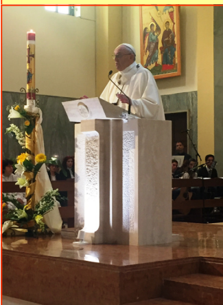
La homilía del Papa Francisco