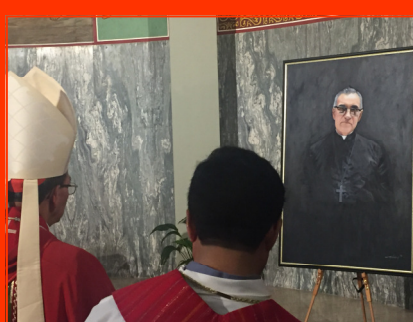
Colocación y posterior veneración de la imagen