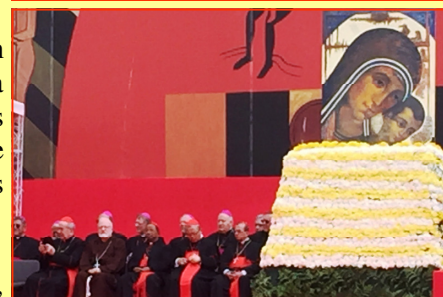
En primer plano junto al Icono de la Virgen del Camino, se puede ver a Su Eminencia el Cardenal Rosa Chávez, con los demás Cardenales y Obispos invitados al encuentro