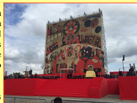
El escenario preparado por el Camino Neocatecumenal en el campus de la Universidad de Tor Vergata. Pueden verse la gran cantidad de Cardenales y Obispos que participaron en el evento

en las vidas de cada uno de sus miembros. Asimismo pondrán en evidencia la vivencia de las comunidades en medio de poblaciones fuertemente descristianizadas.