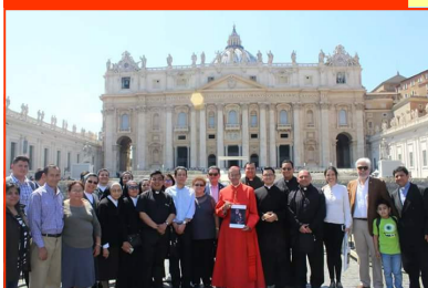
Foto del recuerdo en la Plaza de San Pedro

Después de compartir juntos un refrigerio, nos dirigimos a la Basílica del