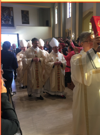
Procesión de ingreso a la Eucaristía