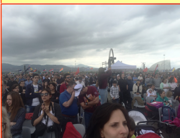
Dos aspectos de la gran multitud de participantes al encuentro donde pueden verse banderas de diferentes países que ondearon durante el evento y que fueron mencionados al ser presentados los respectivos países al Santo Padre, el Papa Francisco.

El Santo Padre, después de oficiar el Te Deum, ofreció un mensaje de sostenimiento y esperanza para las 36 familias en "Missio ad Gentes" que ese día fueron bendecidas y enviadas por él, a solicitud de los obispos, a diferentes países de todo el mundo, secularizados o con muy poca presencia de la iglesia, en donde se instalarán para evangelizar y dar testimonio del amor de Dios