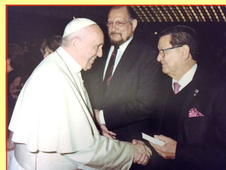
Momentos del saludo al Santo Padre del Embajador ante la Santa Sede y el momento de la bendición de algunas estampas de San Oscar Romero, Obispo y Martir