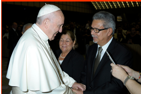
Saludo al Sr. Ministro de RREE, Lic. Carlos Castaneda