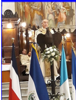
Homilía del Cardenal Maradiaga

Con una solemne Eucaristía celebrada en la histórica Basílica romana de Santa María in Trastevere, se conmemoró el CXCVII Aniversario de la independencia de Costa Rica, El Salvador, Guatemala, Honduras y Nicaragua.