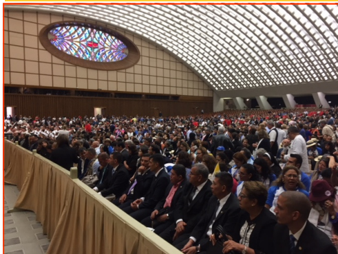
Vista parcial de la Sala Paulo VI durante la audiencia especial