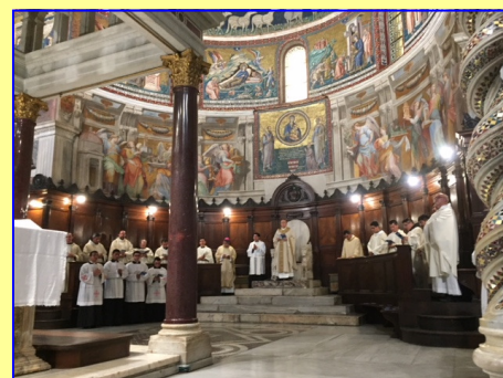
El Presbiterio con el Presidente y los concelebrantes