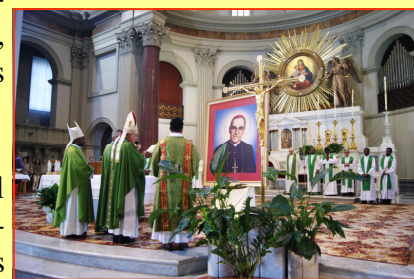
Momento de la bendición del cuadro