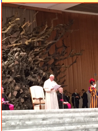
El mensaje del Papa Francisco a todos los salvadoreños

Francisco quien procedió lleno de una visible alegría y con el buen humor que le caracteriza, a saludar a los miles de salvadoreños que se agolparon en las vallas de contención para estrechar su mano, para hacerse un selfie o para recibir una bendición especial para sus hijos.