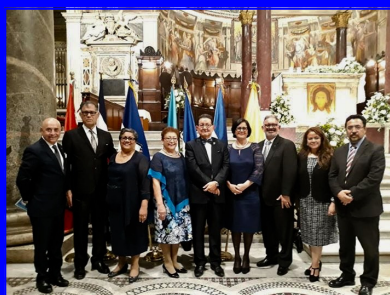
El grupo de los cinco embajadores de Centroamérica recibieron a los invitados y posteriormente posaron para una foto de familia con sus consortes.