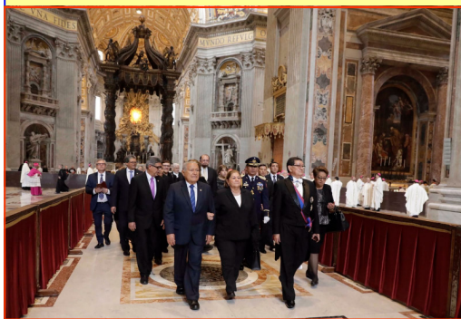
Ingreso del Señor Presidente de la República y Comitiva Oficial de El Salvador

El domingo 14 de octubre, el Papa Francisco presidió la Misa de Canonización del Papa Pablo VI, del Arzobispo de San Salvador Mons. Óscar Romero y de otros cinco nuevos santos, e indicó que todos tenían en común que sabían amar a Jesús con absoluta radicalidad. Así lo señaló el Santo Padre en su homilía, en la que advirtió que Jesús no se conforma con recibir un poco. “Jesús es radical. Él lo da todo y lo pide todo: da un amor total y pide un corazón indiviso”, afirmó. “También hoy se nos da como pan vivo; ¿podemos darle a cambio las migajas? A Él, que se hizo siervo nuestro hasta el punto de ir a la Cruz por nosotros, no podemos responderle sólo con la observancia de algún precepto”. “A Él, que nos ofrece la vida eterna, no podemos darle un