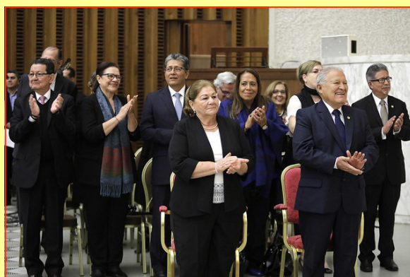
El Señor Presidente de la República, Prof. Salvador Sánchez Cerén y la Sra. Primera Dama

“Desde aquí envío mi saludo a todo el Pueblo Santo de Dios que peregrina en El Salvador y vibra hoy por el gozo de ver a uno de sus hijos en el honor de los altares. Sus gentes tienen una fe viva que expresan en diferentes formas de religiosidad popular y que conforma su vida social y familiar”.