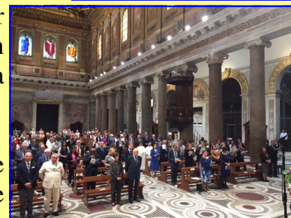
Aspecto de la concurrencia al acto