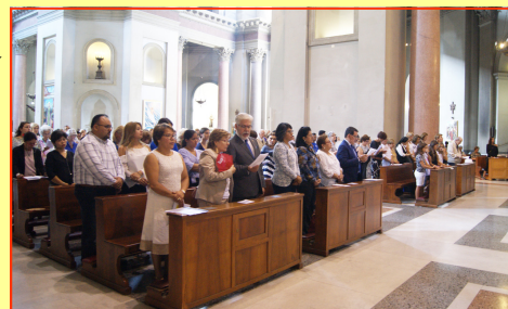
Aspecto de la concurrencia

Posteriormente se procedió a la develación y bendición de la imagen por parte del Obispo Auxiliar de la Diócesis de Roma, Monseñor Guerino Di Tora