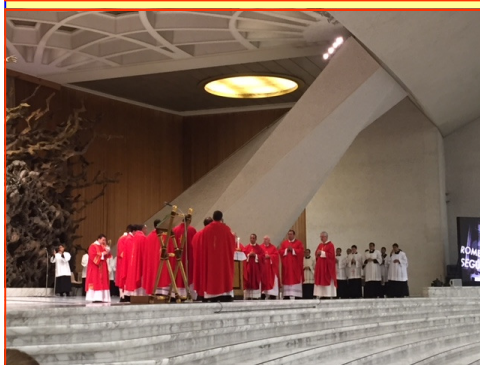
Los concelebrantes de la Eucaristía

El lunes 15 de octubre el Papa Francisco concedió una Audiencia Especial a los más de 5000 salvadoreños que se hicieron presentes en Roma para la Ceremonia de Canonización de San Oscar Arnulfo Romero, quienes se hicieron presentes desde muy temprano en la Sala Paulo VI de la Ciudad del Vaticano.