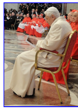
El Papa Emérito Benedicto XVI, sigue con mucha atención el desarrollo del ceremonial de Papa Francisco