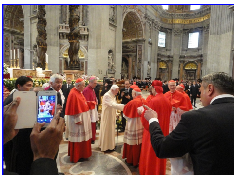
El sorpresivo ingreso de Benedicto XVI y el saludo emotivo de los Cardenales

Hemos querido compartir con ustedes algunas imágenes que consideramos históricas de la sorpresiva asistencia del Papa Emérito, Benedicto XVI en el Consistorio para la elección de los nuevos cardenales de la Santa Iglesia de Roma celebrado el sábado 22 de febrero en la Basílica de San Pedro.