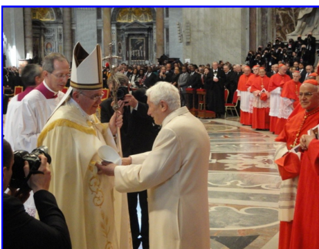
Saludo de despedida del Santo Padre Francisco al Papa Emérito Benedicto XVI