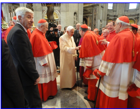
Saludo del Cardenal Rodríguez Maradiaga de Honduras a Benedicto XVI