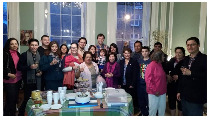
Foto de grupo durante la celebración del Día del Salvadoreño en el Exterior

El sábado 5 de diciembre se realizó en la sede de la embajada la celebración del día del salvadoreño en el exterior con la comunidad de salvadoreños residente en el Reino Unido.