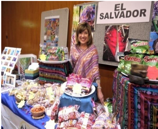
El pabellón de El Salvador en la Feria ALAF

El sábado 10 de octubre se llevó a cabo en el auditorio de Kensington y Chelsea la “Feria y Fiesta Latinoamericana”, organizada por la Fundación Anglo Latinoamericana (ALAF). El objetivo del evento fue promover la cultura y gastronomía de los países latinoamericanos en Londres, a través de la venta de productos artesanales y gastronómicos de cada país. Los fondos recaudados se destinarán a proyectos para niños, niñas y adolescentes de nuestra región en situaciones vulnerables de pobreza.