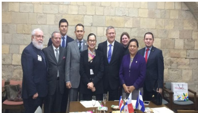
Representantes de las misiones diplomáticas de los países SICA con Andrew Rosindell Presidente del APPG-CA

El jueves 10 de diciembre se atendió la convocatoria del Presidente del Grupo Parlamentario Multipartidista para Centroamérica, Andrew Rosindell, para participar en una reunión de fin de año entre dicho grupo y los jefes de misión de los países miembros del Sistema de Integración de Centroamérica en Londres.