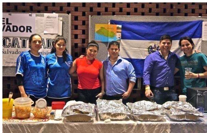
Equipo del restaurante “Cuscatlán”

El sábado 10 de octubre se llevó a cabo en el auditorio de Kensington y Chelsea la “Feria y Fiesta Latinoamericana”, organizada por la Fundación Anglo Latinoamericana (ALAF). El objetivo del evento fue promover la cultura y gastronomía de los países latinoamericanos en Londres, a través de la venta de productos artesanales y gastronómicos de cada país. Los fondos recaudados se destinarán a proyectos para niños, niñas y adolescentes de nuestra región en situaciones vulnerables de pobreza.