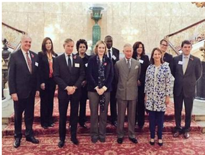
Ministra de Medio Ambiente de El Salvador con el Príncipe Carlos de Gales y participantes en la Conferencia sobre Bosques y Cambio Climático

El enfoque principal de la discusión fue la inclusión de temas relacionados a bosques y Reducción de Emisiones por Deforestación y Degradación de los Bosques (REDD), en el acuerdo de cambio climático de la 21 Conferencia de las Partes de la Convención Marco de Naciones Unidas sobre el Cambio Climático llevada a cabo del 30 de noviembre al 11 de diciembre en la ciudad de París.