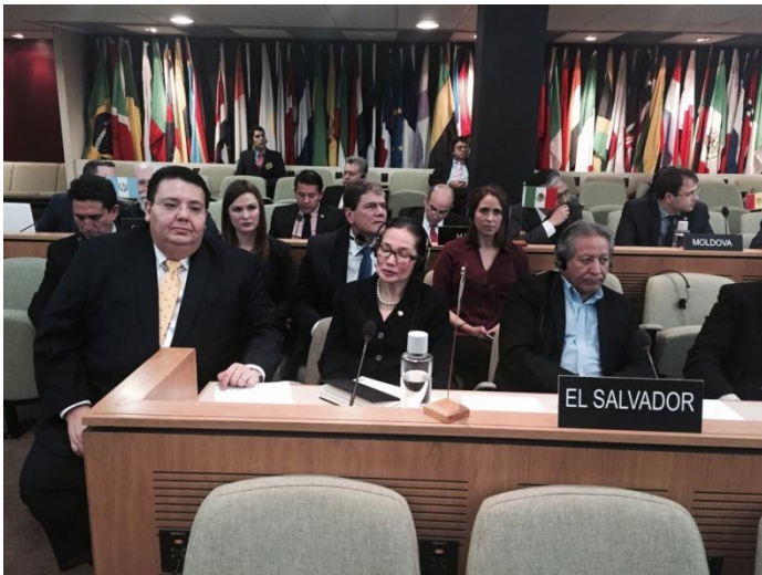
Delegación de El Salvador durante las sesiones de la OIA

Los días martes 17 y miércoles 18 de noviembre participamos junto con la delegación del sector azucarero de El Salvador en la 24 edición del Seminario Internacional del Azúcar de la OIA. Durante el seminario se tratan los temas de actualidad e interés para el sector azucarero a nivel mundial. Asimismo participamos en la 46 sesión del Comité de Evaluación de Mercado, Consumo y Estadísticas (MECAS) y en la 48 Sesión del Consejo Internacional del Azúcar.