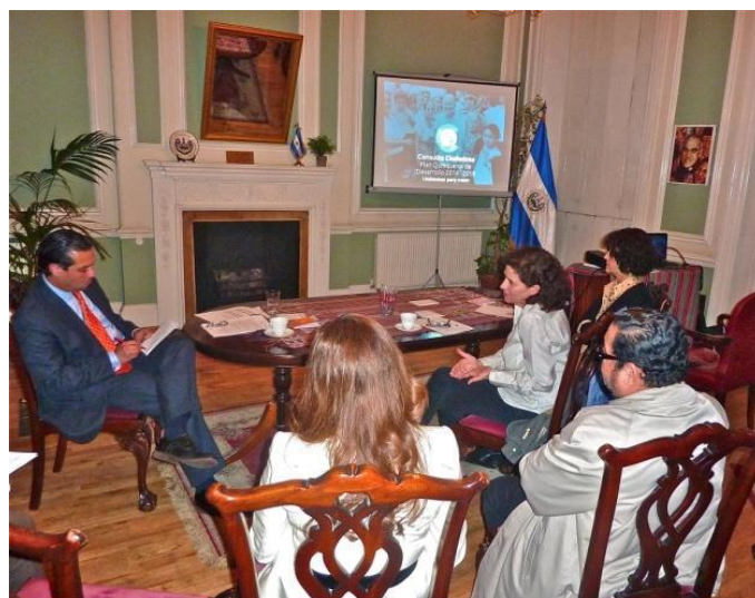
Compatriotas aportan sus comentarios

Al encuentro se dio cita a un grupo diverso de salvadoreños de diferentes profesiones y oficios, entre quienes se contó con líderes comunitarios, consultores y pequeños empresarios. Fue evidente el vínculo solidario de los asistentes con El Salvador y su compromiso inicial de aportar valiosos comentarios y recomendaciones.