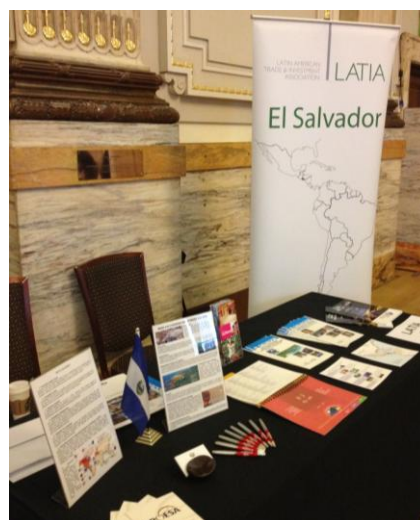
Stand de El Salvador en Canning House