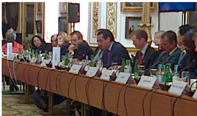
Embajador Romero (al centro) se dirige al plenario de la conferencia internacional sobre el ébola

El Salvador fue representado en la conferencia internacional “Derrotando el Ébola en Sierra Leona” por el embajador de El Salvador en el Reino Unido el pasado jueves 2 de octubre. La conferencia fue organizada conjuntamente por los gobiernos del Reino Unido y Sierra Leona con el objeto de convocar a la comunidad internacional para dar una respuesta articulada a la crisis a raíz de la epidemia de ébola que sufre algunos países del África Occidental.