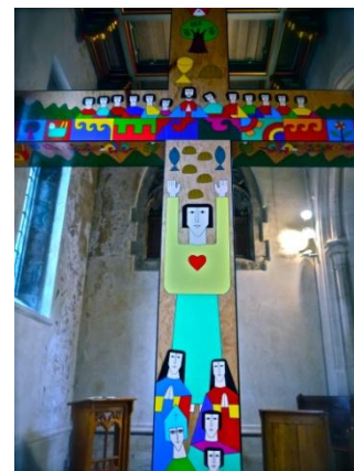
Cruz de Fernando Llort en honor a Monseñor Romero, Catedral de San Jorge, Londres