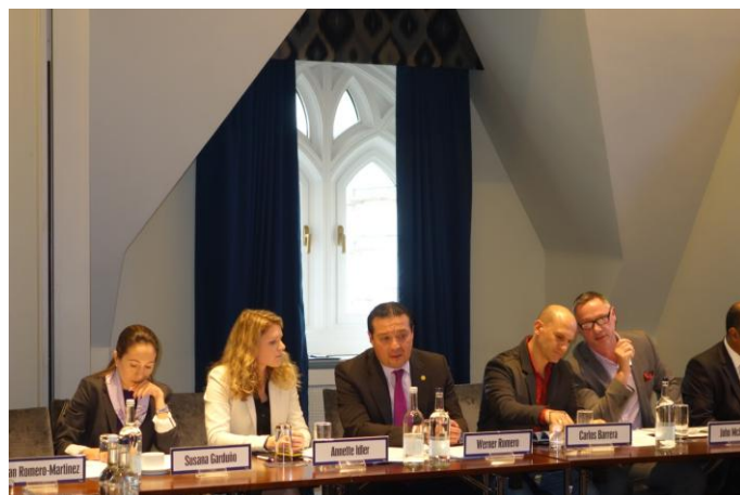
Embajador Romero (al centro) participa en seminario de modernización y aplicación de legislación sobre drogas

El día 5 de noviembre el embajador Werner Matías Romero participó en calidad de moderador en el Seminario de Modernización y Aplicación de Legislación sobre Drogas organizado por el Instituto Internacional de Estudios Estratégicos de Londres ( International Institute for Strategic Studies, IISS ), el Consorcio Internacional para Legislación en Materia de Drogas ( International Drug Policy Consortium, IDPC ) y Chatham House (Real Instituto para Asuntos Internacionales de Londres).