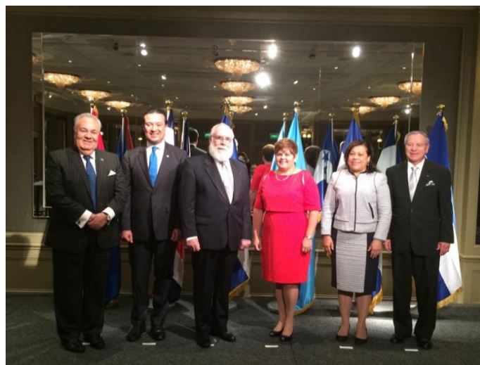
Jefes de Misión de Centroamérica y Belice

En un esfuerzo sin precedentes, el miércoles 16 de septiembre, bajo la coordinación de esta representación como presidencia pro témpore del SICA, se realizó la histórica celebración conjunta del 194° aniversario de la Independencia de Centroamérica y el 34° aniversario de la Independencia de Belice. El evento se realizó en el Hotel The Churchill Hyatt .