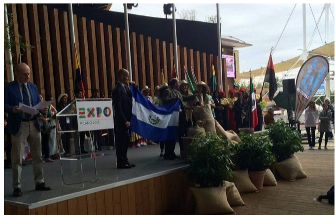
La delegación de El Salvador participa en el Primer Día Internacional del Café en la EXPO Milano 2015

Durante su estadía en Milán, la delegación de El Salvador visitó el pabellón de El Salvador en el cluster del café en la EXPO Milano y participó en la celebración del Primer Día Internacional del Café, cuyo lanzamiento tuvo lugar en las instalaciones de la EXPO Milano e inició con un desfile que finalizó con una ceremonia en el pabellón de prensa de la feria, en la que cada delegación de los países productores, incluida la salvadoreña, simbólicamente aportó granos de café de cada país.