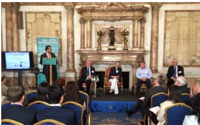
Foro SICA Dublín, Irlanda

En la apertura del evento, el Secretario General de la Cancillería Irlandesa, Niall Burgess reiteró “Esta es una importante oportunidad para examinar como Irlanda y los países SICA pueden expandir sus relaciones comerciales. Los niveles de comercio actuales son de aproximadamente 200 millones de euros por año, pero hay un margen para el aumento del mismo. La región centroamericana e Irlanda tienen fuertes y complementarias exportaciones del sector agrícola y pueden crecer en áreas como dispositivos médicos, software de telecomunicaciones y equipo. Mientras la región continúe con su impresionante desarrollo económico se puede explorar la posibilidad de ampliar negocios en servicios financieros, aviación e intercambios educativos” .