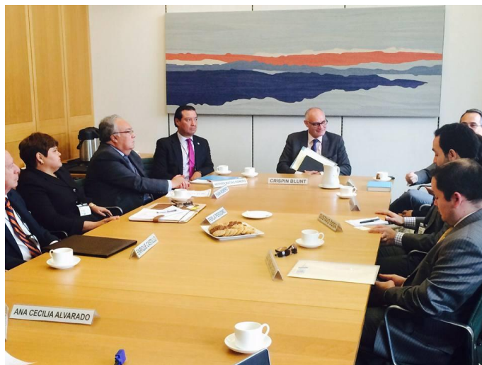
Reunión de los Jefes de Misión o sus representantes de los países del SICA con miembros del Comité para Asuntos Exteriores del Parlamento Británico

Los jefes de misión o sus representantes de las misiones diplomáticas de los países miembros del SICA sostuvieron el 7 de septiembre una reunión con parlamentarios miembros del Comité para Asuntos Exteriores del Parlamento británico. La reunión fue organizada por esta embajada en su calidad de PPT-SICA y se llevó a cabo en el Parlamento británico.