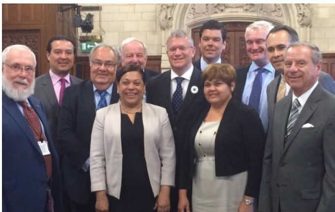
Jefes de Misión de los países del SICA se reúnen con miembros del Grupo Parlamentario Multipartidista para Centroamérica

Con el objeto de presentar las prioridades de El Salvador como la PPT-SICA este semestre y a solicitud de esta embajada, el pasado 6 de julio los jefes de misión de los países SICA sostuvieron una reunión en el Parlamento británico con miembros del Grupo Parlamentario Multipartidista para Centroamérica (APPG-SICA, por sus siglas en inglés).