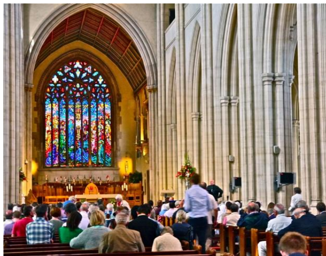
Misa de acción de gracias para celebrar la beatificación de Monseñor Óscar Romero

Con motivo de celebrarse el natalicio de Monseñor Óscar Arnulfo Romero la embajada de El Salvador en Londres participó el sábado 15 de agosto en una misa de acción de gracias para celebrar su vida, martirio y beatificación. La misa fue organizada por la Fundación Arzobispo Romero ( Archbishop Romero Trust – ART) y se llevó a cabo en la Catedral de San Jorge, en el distrito de Southwark en Londres.