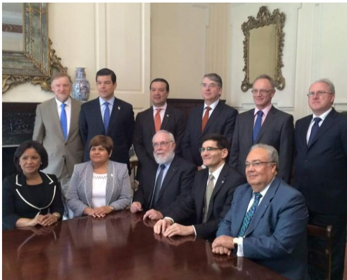
Jefes de Misión de los países del SICA con el Secretario General del Departamento de Asuntos Exteriores y Comercio de Irlanda y Directivos del Foro Latinoamericano de Negocios de Dublín, en la apertura del Foro SICA Dublín

La embajada de El Salvador ante el Reino Unido, concurrente para Irlanda, en su calidad de Presidencia Pro Témpore del SICA para este semestre y en coordinación con Cancillería Irlandesa, el Foro Latinoamericano de Negocios de Dublín ( Latin America Trade Forum, LATF ) y el resto de representaciones diplomáticas de los países del SICA, organizó el 10 de julio un seminario sobre oportunidades de negocios en Centroamérica en Dublín, Irlanda. El evento se llevó a cabo en el salón de honor de la cancillería irlandesa.