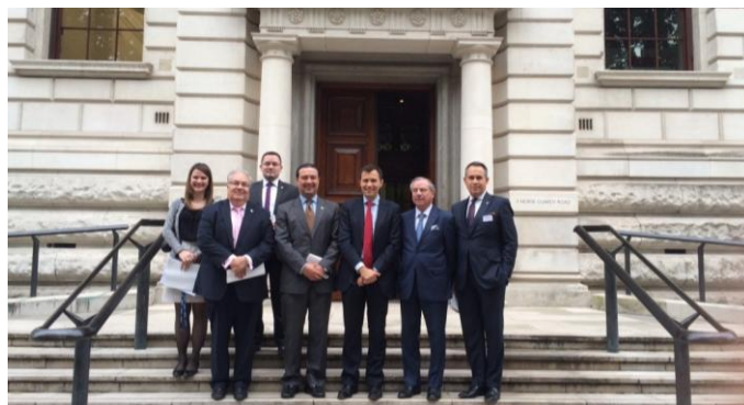
Jefes de Misión y representantes del SICA visitan el Ministerio de Finanzas del Reino Unido