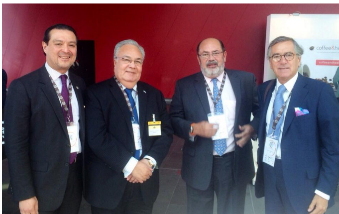
La delegación de El Salvador y otros enviados al Consejo