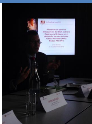
Presentación sobre la experiencia británica en relación al modelo de Asociación Público Privada

La actividad coordinada entre dicha entidad y la embajada de El Salvador en Londres en su calidad de presidencia pro témpore del SICA, tuvo como objeto discutir la experiencia del Reino Unido en el desarrollo de infraestructura económica, social y medioambiental bajo su modelo de Asociación Público Privada (APP) llamado Private Finance Initiative / Private Finance 2 (PFI/PF2), así como también conocer sobre el trabajo de Infrastructure UK en la región centroamericana.