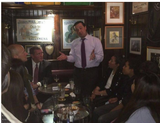
Embajador Romero actualiza y comparte con la comunidad de salvadore  os residentes en Irlanda

Este verano esta embajada gir   una invitaci  n a la comunidad salvadore  a residente en Irlanda para sostener un encuentro informal e intercambiar sus impresiones e inquietudes.