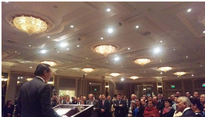
Embajador Romero de El Salvador se dirige a la audiencia con un discurso de despedida

vinculadas con la región. Asistieron aproximadamente 200 personas.