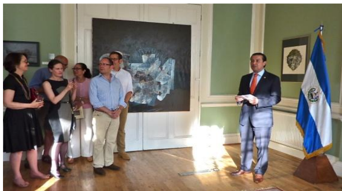
Embajador Romero dando sus palabras inaugurales en la muestra del artista Rodolfo Oviedo Vega

plata, encajes de la India, corteza de coco, hoja de plátano, y arena del Himalaya o de las playas de El Salvador.