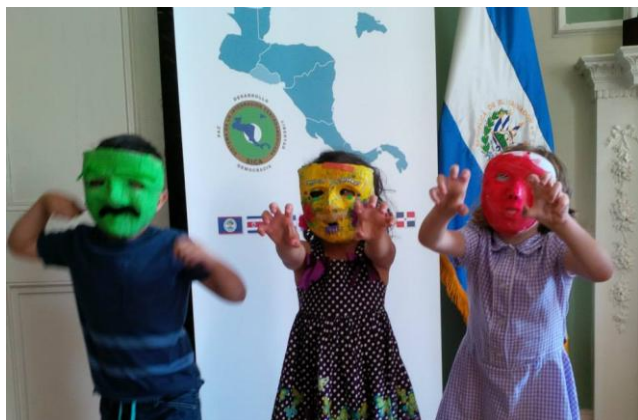
Los viejitos de agosto en la embajada

Los viejos de agosto llegaron el 3 de agosto a la embajada en Londres para celebrar las fiestas agostinas en honor al Divino Salvador del Mundo, gracias a un convivio con la comunidad salvadoreña realizado en coordinación con el grupo de Facebook “Salvadoreños en el Reino Unido”.