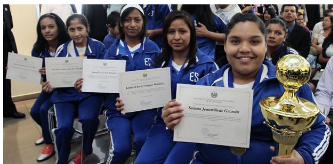
Equipo salvadoreño con diplomas y trofeo de tercer lugar

Las futbolistas fueron seleccionadas de los proyectos que impulsa la Fundación Viva, entidad que trabaja con jóvenes en zonas de alto riesgo con la finalidad de alejarlos de la violencia intrafamiliar y social. Las jóvenes triunfadoras pertenecen a los proyectos infantiles “Jesús es mi Rey” de la Comunidad Fenadesal Sur, “El taller de Jesús” del Mercado Central de San Salvador, y la Asociación Salvadoreña Pro-Salud Rural (Asaprosar) en Santa Ana, los cuales son algunos de los ministerios con los que la Fundación Viva trabaja.