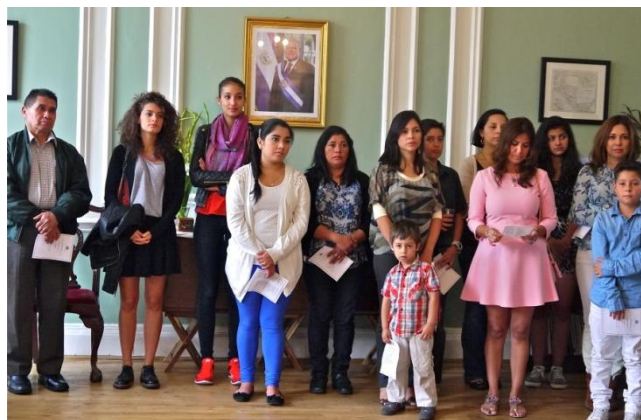
Compatriotas invitados a la celebración de la Independencia

El domingo 14 de septiembre la gran familia salvadoreña en el Reino Unido se reunió en una tarde cívica en la sede de la embajada para conmemorar el 193° Aniversario de la Independencia de Centroamérica.