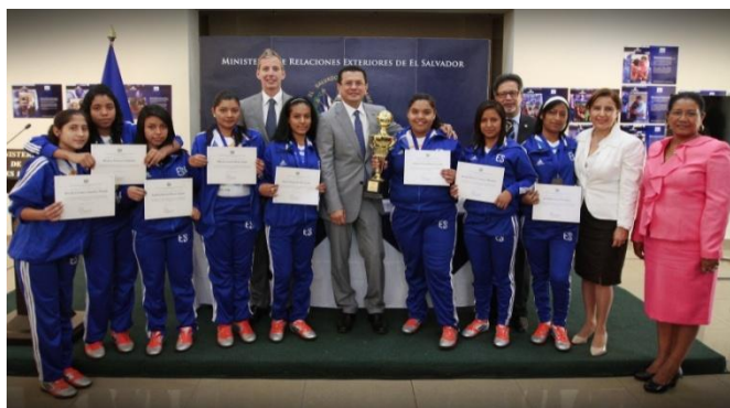
Canciller Martínez con niñas del equipo de El Salvador que participó en la Copa Mundial de Fútbol de Niños de la Calle

El Ministerio de Relaciones Exteriores ofreció en julio un especial reconocimiento al equipo de fútbol salvadoreño de niñas que participó en la Copa Mundial de Fútbol de Niños de la Calle, que se realizó en Río de Janeiro, Brasil, del 28 de marzo al 7 de abril de 2014. El equipo de nueve niñas fue patrocinado por la organización caritativa británica Toybox .