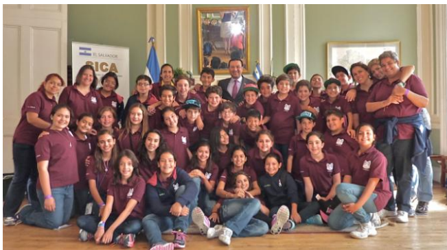
Grupo de estudiantes y profesoras de la Academia Británica Cuscatleca en la embajada de El Salvador

Un grupo de 36 estudiantes salvadoreños de la Academia Británica Cuscatleca (ABC) y sus profesoras guías visitaron el 1 de julio a sede de esta embajada.