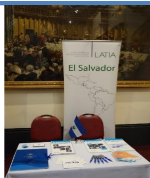
Stand de El Salvador

LATIA es una organización sin fines de lucro que agrupa a las secciones económicas y oficinas de promoción de 19 embajadas latinoamericanas en Londres. LATIA coordina y promueve el sector económico de Latinoamérica para atraer inversión hacia la región e impulsar nuestras exportaciones.