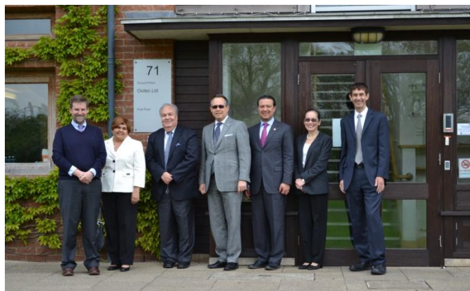
Embajadores y representantes de los países del SICA en Oxitec

mosquito Aedes es cada vez peor. Estudios recientes muestran que los casos anuales reportados de dengue han aumentado 30 veces en los últimos 50 años infectando a 350 millones de personas, más de tres veces la estimación hecha por la Organización Mundial de la Salud (OMS).