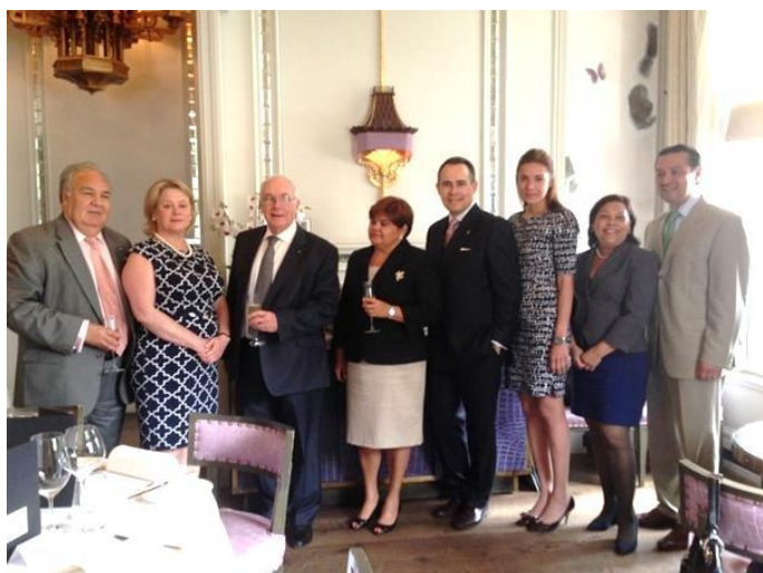
De izquierda a derecha, Embajadores de Honduras, Costa Rica y Guatemala; Alta Comisionada de Belice; Embajadores de la República Dominicana y Panamá; la Encargada de Negocios de Nicaragua, y el Embajador de El Salvador, luego del acto de traspaso de la presidencia pro témpore del SICA

El evento contó con la presencia de embajadores de Costa Rica, El Salvador, Guatemala, Honduras, Panamá y la República Dominicana, la Alta Comisionada de Belice y la Encargada de Negocios de Nicaragua.