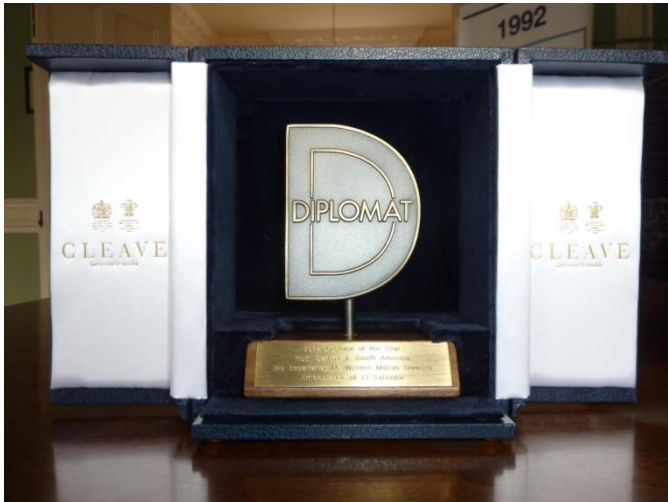
Premio “Diplomático del Año para Centro y Suramérica 2014”

Con una ceremonia el día 14 de abril la revista DIPLOMAT hizo la entrega de premios a diplomáticos destacados durante el año 2014. Este año el premio al Diplomático del Año para la región de Centro y Suramérica fue otorgado al embajador Werner Matías Romero de El Salvador.