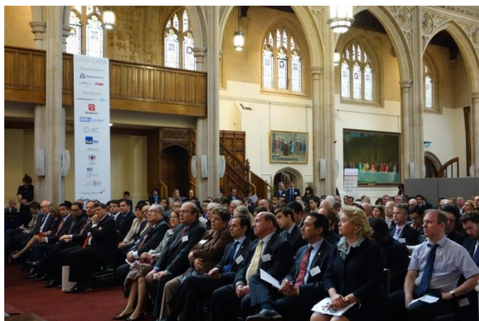
Embajadores latinoamericanos en Foro Latinoamericano de Inversiones de Londres 2014 (LAIF)

El gobierno británico y la City of London han demostrado un creciente interés en América Latina, lo cual se ve reflejado en las diversas visitas llevadas a cabo por representantes británicos de alto nivel a la región.