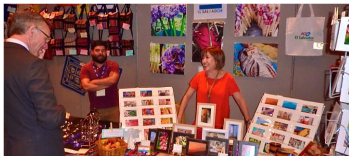
Pabellón de El Salvador en la Feria Internacional de Primavera

El Salvador estuvo representado en la 55ª Feria Internacional de Primavera, organizada por la organización caritativa Children and Families Across Borders (CFAB) que se realizó del 13 al 14 de mayo en el auditorio de la alcaldía de Kensington.