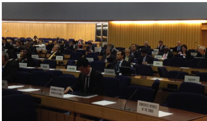
Embajador Romero representando a El Salvador en el Consejo de la OMI

Este trimestre la agenda en la Organización Marítima Internacional (OMI) abarcó reuniones intensas en el seno de dicho organismo.