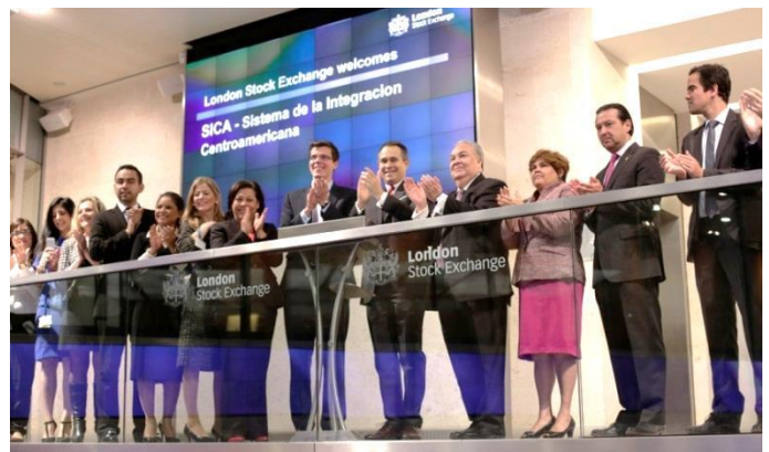
Embajadores de los países del SICA en ceremonia de apertura de la Bolsa de Valores de Londres

El embajador de El Salvador participó, junto a sus colegas de los países del SICA, en la ceremonia de apertura de la Bolsa de Valores de Londres el día 6 de junio.