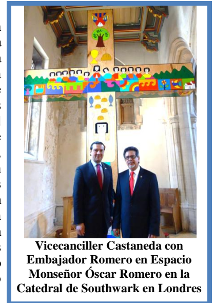
Vicecanciller Castaneda con Embajador Romero en Espacio Monseñor Óscar Romero en la Catedral de Southwark en Londres

En el marco de su visita para participar en la Cumbre Mundial para poner fin a la Violencia Sexual en Situaciones de Conflicto (PSVI, por sus siglas en inglés), el Viceministro de Relaciones Exteriores, Integración y Promoción Económica, Lic. Carlos Castaneda, realizó en junio un programa bilateral de trabajo para profundizar las relaciones de cooperación, comercio e inversión con el Reino Unido.