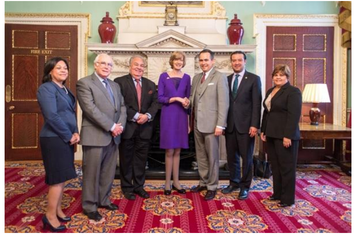
Alcaldesa de la City (al centro) con los Embajadores de El Salvador, Guatemala, Honduras y República Dominicana, la Alta Comisionada de Belice y la Encargada de Negocios de Nicaragua

Los embajadores de los países del SICA realizaron el 5 de junio una visita a Mansion House , palacio en el que reside y trabaja la Sra. Fiona Woolf, actual alcaldesa de la City of London (centro financiero de Londres).