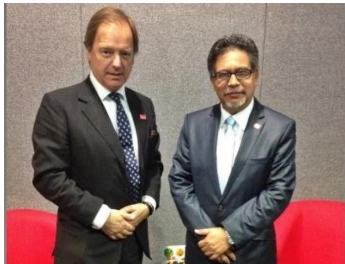
Vicecanciller Carlos Castaneda (d.) con Ministro Hugo Swire

El 12 de junio, durante el desarrollo de la Cumbre PSVI, el Viceministro Castaneda sostuvo una reunión bilateral con Hugo Swire, Ministro de Estado para Latinoamérica de la cancillería británica (FCO en inglés).