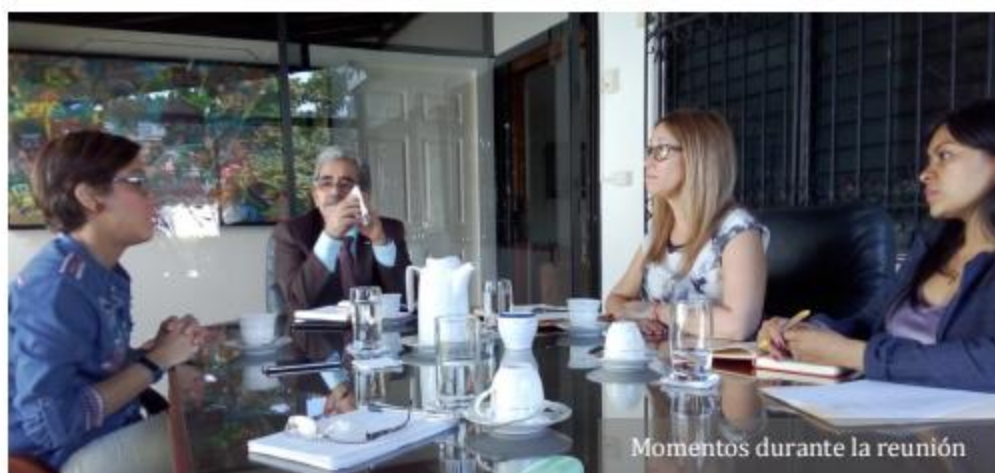
Momentos durante la reunión

escuela República de El Salvador, así como los convenios o acuerdos en proceso y otras iniciativas que podrían ser de beneficio para la educación ambiental en Panamá.