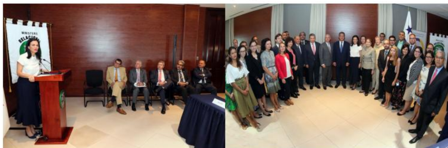
Momentos durante y después del acto de clausura

ciones entre Centroamérica y la Unión Europea. El acto de clausura, realizado el 7 de septiembre, fue presidido la Señora Vicepresidenta y Canciller de la República, Isabel de Saint Malo de Alvarado y se llevó a cabo en el salón Reverendo Padre Fernando Guardia Jaén, del Ministerio de Relaciones Exteriores.