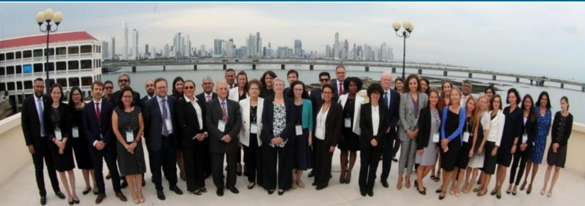
Participantes del programa

Del 3 al 7 de septiembre se llevó a cabo en la Academia Diplomática del Ministerio de Relaciones Exteriores el Primer Programa para Jóvenes Diplomáticos, gracias a la colaboración y participación de la Fundación EU-LAC y las academias