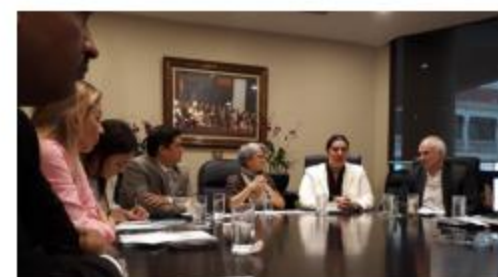
Representantes de México, Panamá y Guatemala, durante el segundo día del taller

La capacitación sobre la implementación de los ODS en el contexto iberoamericano fue impartida por el Programa de las Naciones Unidas para el Desarrollo (PNUD).