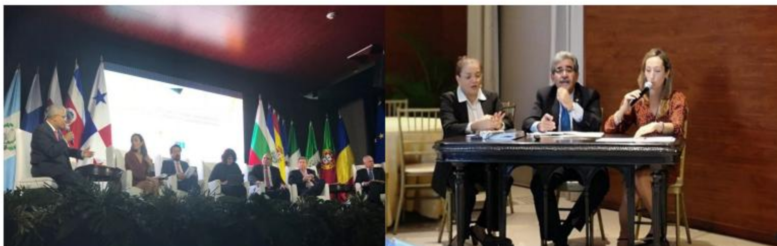
Izquierda: En el Panel Inaugural participaron funcionarios de la Unión Europea, el Instituto Alemán para los Asuntos internacionales y de Seguridad y Embajadores de México, España, Perú y República Dominicana. Derecha: Embajador Pineda, participando como moderador en la mesa redonda"

de la Embajada de El Salvador, por el Señor embajador, Alfredo Salvador Pineda Saca, quienes participaron activamente en los paneles y mesa redonda, como ponente y moderador, respectivamente.