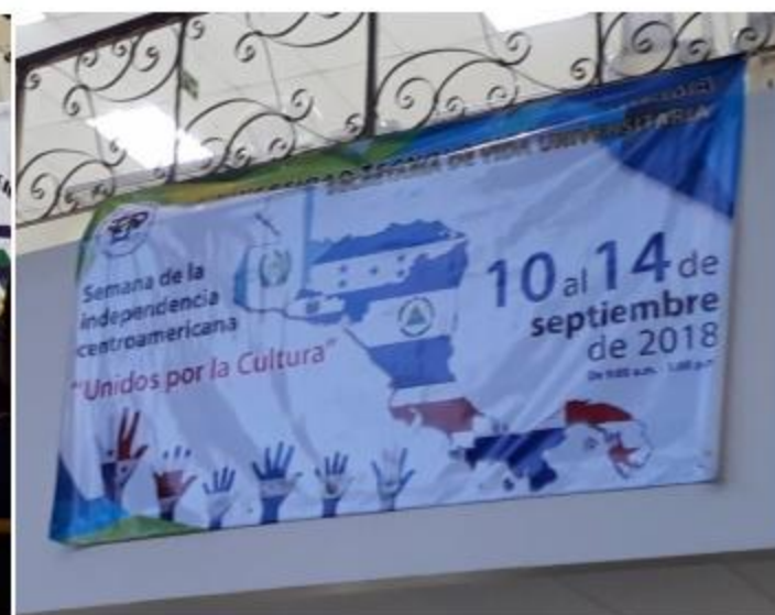
El acto inaugural fue presidido por el Señor Rector de la Universidad Tecnológica de Panamá, así como por la Señora embajadora y los Señores embajadores y de los países de Centroamérica