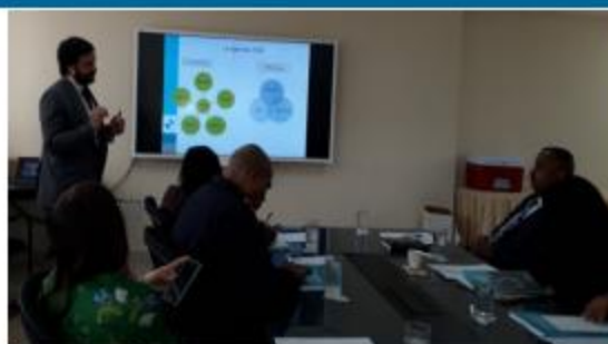
Exposición de experto, durante el primer día del taller

La Secretaría General Iberoamericana (SEGIB) con el apoyo de Panamá Coopera y la Agencia Española de Cooperación (AECID), llevó a cabo el taller en el Ministerio de Relaciones Exteriores los días 13 y 14 de septiembre.