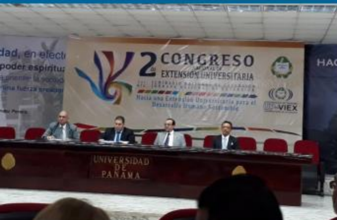
Autoridades de la Universidad de Panamá, del Consejo Superior Universitario Centroamericano y de la Universidad Estatal del Sur de Manabí, Ecuador.