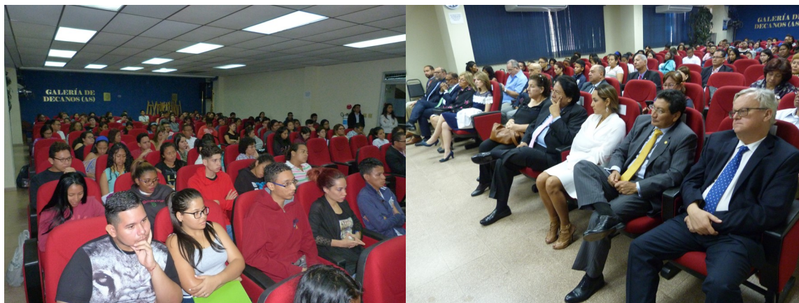
Izquierda: Estudiantes de la carrera de Relaciones Internacionales. Derecha: En primeras filas, miembros del Cuerpo Diplomático.

Al concluir su ponencia, el Señor Embajador, recibió de manos del Señor Decano un Diploma de agradecimiento por su contribución a la Facultad de Administración Pública.