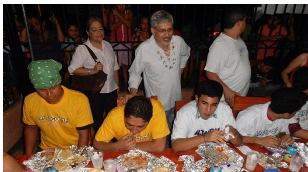
Embajador Figueroa (al centro de pie) alentando a los concursantes a batir el récord del año pasado en Nicaragua de 24 pupusas.

Dicho decreto ha trascendido fuera de las fronteras patrias ya que es celebrado en diversas partes del mundo.