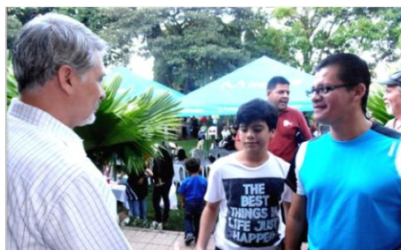
Embajador Figueroa saluda miembros de la comunidad salvadoreña.