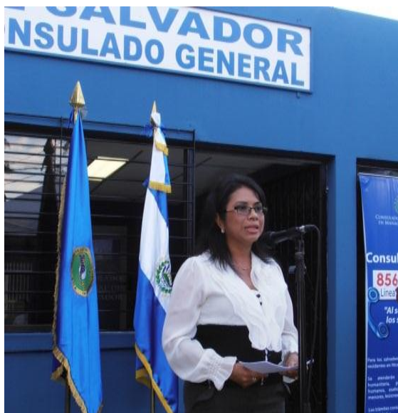
Sara Elizabeth Martínez Quintana, Cónsul General, explicó el funcionamiento de dicho concepto.

Esta actividad se realiza en el marco de la celebración del "Día del Salvadoreño en el Exterior", decretado por la Asamblea Legislativa en el año 2005.