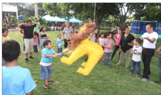
Quiebra de piñatas