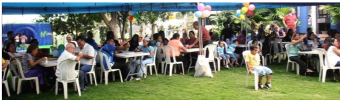
Vista general del público asistente.