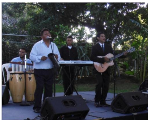
Grupo musical nicaragüense Revival.

Se contó con el patrocinio de Movistar Nicaragua, Nilac Yogurt Yess, Grupo Golán Nicaragua, Megaboutique, Impresa Repuestos, Hotel Real Intercontinental, Transportes del Sol, Tropigás, La Curacaco y Banpro.