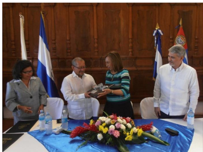
Alcaldesa Mena entrega las llaves de la ciudad a su homólogo de Santa Ana.