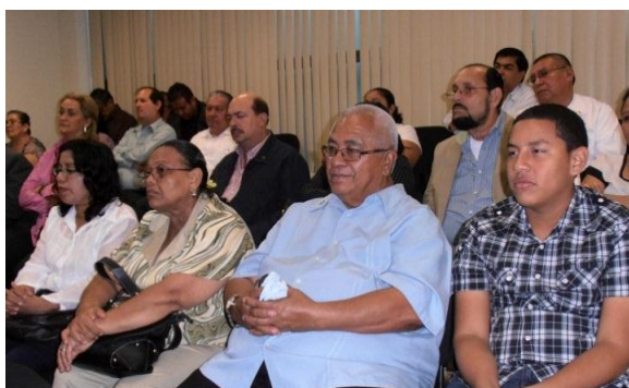
Diputados asistentes y público en general.