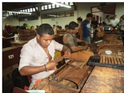
Durante recorrido a empresa tabacalera en Estelí, mayor industria de la zona.