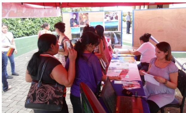
Se brindó información turística sobre El Salvador. Compatriotas aprovecharon para consultar sobre servicios consulares.