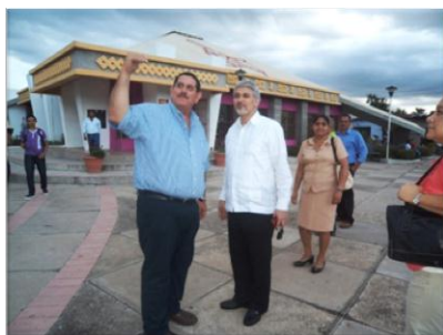
Visita al museo de Estelí.