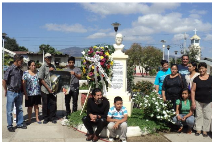
Compatriotas salvadoreños residentes en la ciudad de Estelí al momento de colocar ofrenda floral en el busto del Beato Óscar Arnulfo Romero.

El jueves 24 de marzo, los compatriotas colocaron una ofrenda floral al monumento de Monseñor Romero, ubicado en el parque Domingo Gadeas, de la ciudad de Estelí, situada al norte de Nicaragua.