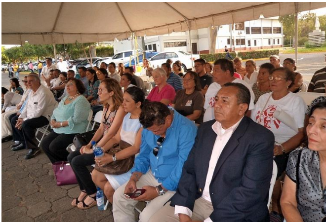
Asistentes a la Conmemoración del 36 Aniversario del Martirio de Monseñor Romero. Asistieron diputados de la Asamblea Nacional, Cuerpo Diplomático, compatriotas salvadoreños, Comunidades de Base, Comunidad San Romero de América, Comunidad San Egidio e invitados especiales.