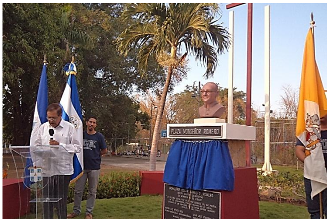
El embajador Carlos Ascencio brindó palabras alusivas.