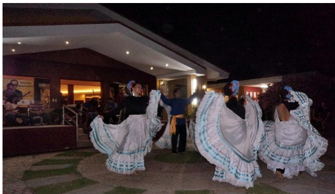
Como punto cultural hubo danzas y cantos por parte de jóvenes nicaragüenses, así como degustación de pupusas y hortacha salvadoreñas.