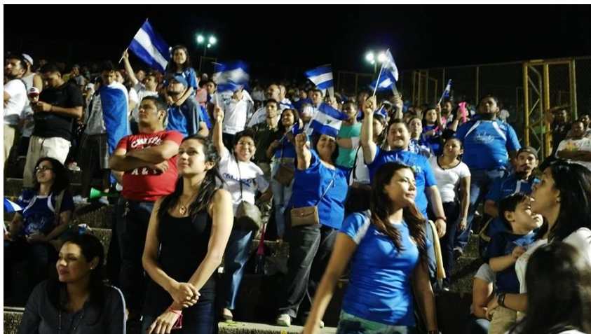
Reportero deportivo del canal TN8 de Managua entrevistando integrantes de la barra salvadoreña

La afición se dio cita al partido vistiendo con las camisetas distintivas, banderas y trompetas para animar a la Selección Nacional.