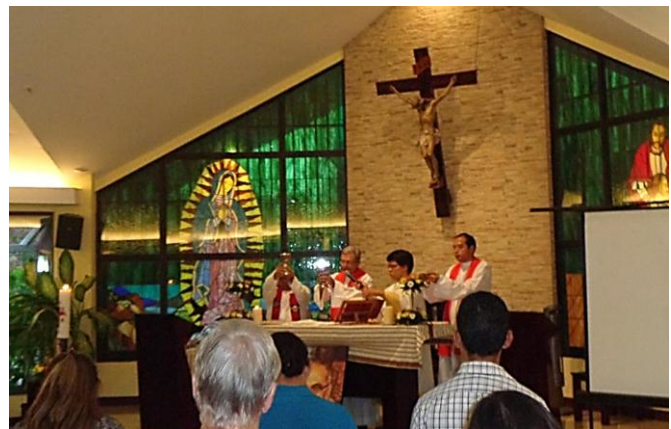
Misa en honor al Beato Óscar Romero.