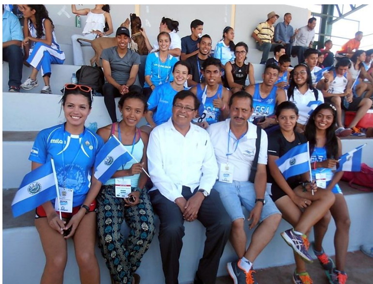
Embajador Carlos Ascencio con delegación salvadoreña.

El Embajador de El Salvador en Nicaragua, Carlos Antonio Ascencio Girón asistió a la inauguración del campeonato, ocasión en la cual conversó con los atletas. Asimismo tuvo el honor de premiar a tres jóvenes atletas salvadoreñas que ganaron oro, plata y bronce en 5000 metros.