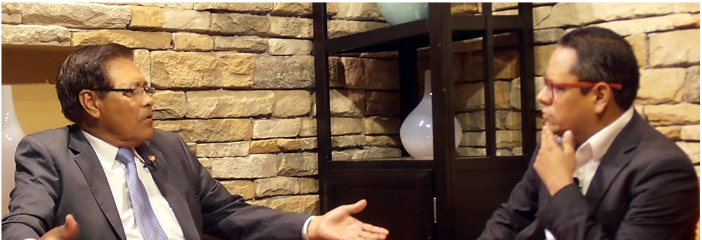
Entre los puntos de conversación fue la fuerte inversión de la pequeña y gran empresa salvadoreña en Nicaragua.