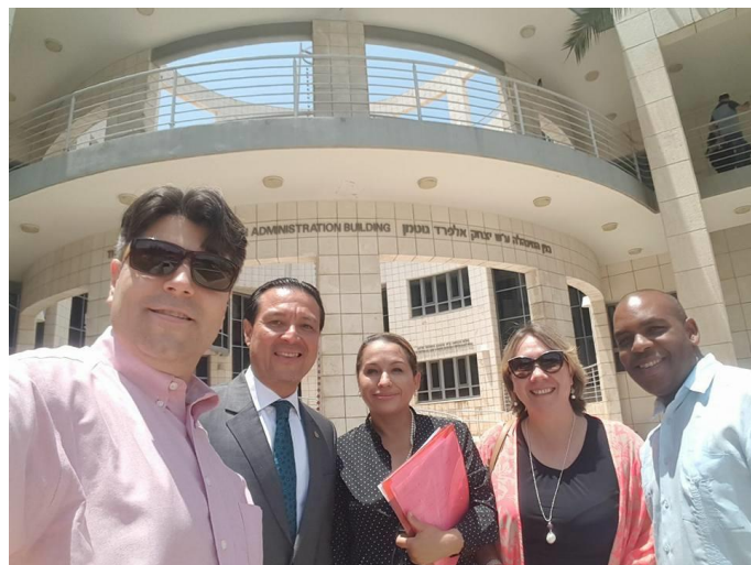
Embajadores del SICA en la Universidad Tel Aviv

Adicionalmente, se conversó sobre la disponibilidad de becas para estudiantes de la región del SICA que quieran venir a estudiar a este importante centro de estudios universitarios en Israel.