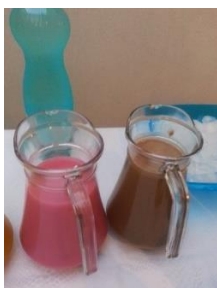
Refrescos de cebada y horchata