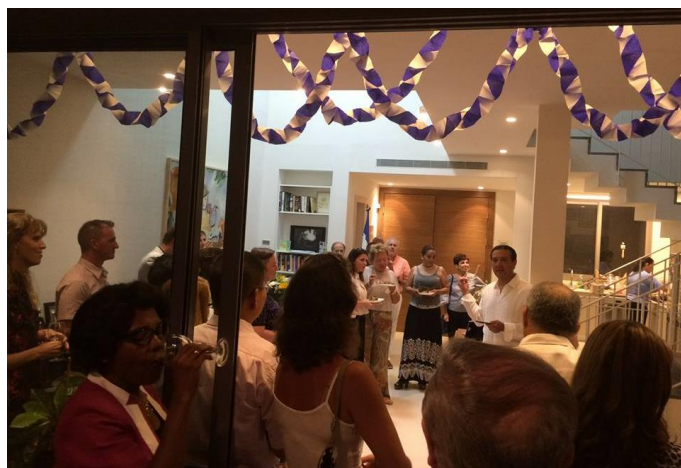
Asistentes a la celebración agostina

“En la época en que adoptamos el nombre de El Salvador, allá por 1830, enfrentábamos guerra y pobreza, problemas que aún enfrentamos de diferente manera hoy en día. Pero hemos avanzado mucho y los salvadoreños haremos mucho más, pues no importando nuestra perspectiva política, estamos unidos en el compromiso con la democracia, la paz y el pluralismo. El sistema democrático que hoy gozamos nació de los acuerdos de paz de 1992, y nosotros y nuestras instituciones lo seguimos respaldando”, finalizó diciendo el diplomático salvadoreño.