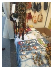
Bisutería de materiales naturales

En los últimos cuarenta años, el festival se ha convertido en una tradición en Jerusalén y la atracción turística más grande en la época de verano. El festival se realiza en un área de 5,000 m2 en una de las localidades más bonitas de Jerusalén, la “Piscina del Sultán”, al pie de las murallas de la Ciudad Vieja, en donde artistas y artesanos exponen sus creaciones a los visitantes locales e internacionales.