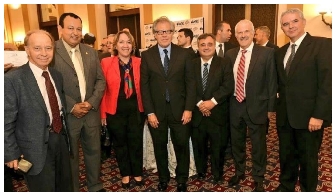
Embajadores latinoamericanos con el Secretario General Almagro

La embajada de El Salvador participó el 9 de agosto en un encuentro en Jerusalén entre embajadores americanos, periodistas y otros interesados en la región con S.E. Luis Almagro, Secretario General de la Organización de los Estados Americanos (OEA). El evento fue organizado conjuntamente por el Israel Council on Foreign Relations ( http://www.israelcfr.com/ ) y el World Jewish Congress in Israel ( http://www.worldjewishcongress.org/en ).