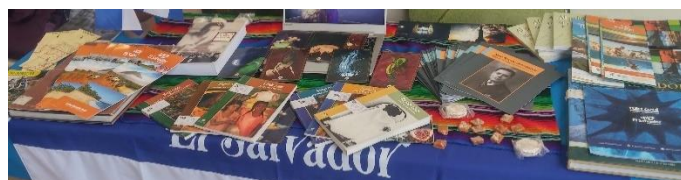
Stand de El Salvador

El Salvador contó con un espacio de exhibición en el que se mostró literatura salvadoreña con obras de autores como Roque Dalton, Salarrué, Claudia Lars, Hugo Lindo y Alfredo Espino. Este año se brindó una cálida bienvenida a los asistentes aludiendo a la celebración de nuestra Independencia Patria, obsequiándoles dulces típicos así como material turístico y gastronómico de El Salvador.