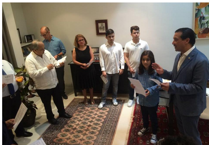
El embajador Romero se dirige a miembros de la comunidad en el acto cívico conmemorativo

Con música, sabor salvadoreño y mucho fervor patriótico, el 13 de septiembre, la embajada de El Salvador realizó una tarde cívica en la residencia del embajador salvadoreño junto a la comunidad salvadoreña residente para celebrar en Israel el Día de la Independencia Patria.