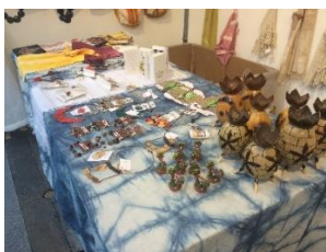
Artesanías salvadoreñas en exhibición y venta