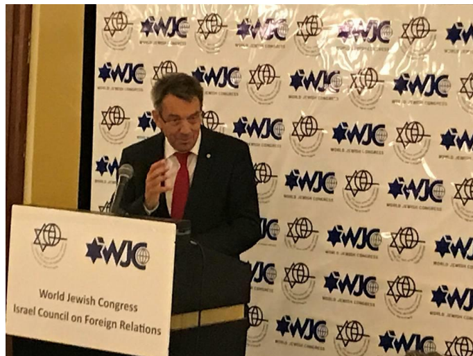
Dr. Peter Maurer durante su disertación

violencia. El CICR fue instrumental para la protección de la población civil durante el conflicto armado de El Salvador que finalizó con los Acuerdos de Paz de 1992.