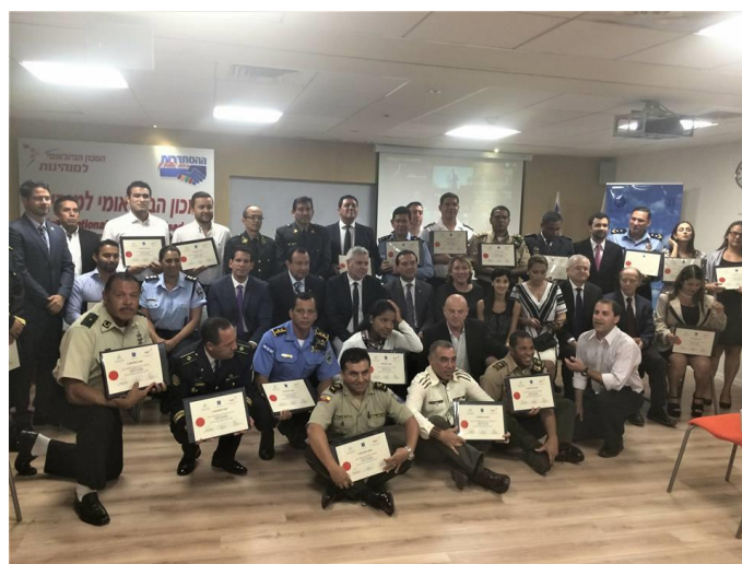
Foto de familia de becarios y embajadores latinoamericanos, y docentes del Instituto Beit Berl

Los 24 becarios provenientes de 11 países latinoamericanos desarrollaron proyectos y visitas de campo a ciudades periféricas, así como recibieron charlas de autoridades policiales israelíes, con el fin de aprender sobre prevención y vinculación de la policía con la comunidad, así como el proyecto de ciudades sin violencia que aplica Israel.