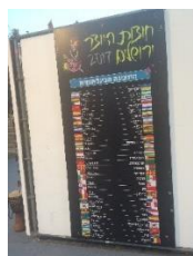
Lista de países participantes en el festival

El festival incluyó este año a más de 200 de los mejores artistas y artesanos israelíes, así como exhibiciones y stands de objetos de arte y artesanías de Centro, Sur y Norteamérica, Europa, Asia y África. De Latinoamérica participaron este año Argentina, Bolivia, Chile, Colombia, Ecuador, El Salvador, México, Panamá, Perú y Uruguay.