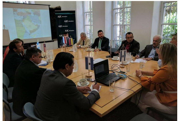
Diplomáticos latinoamericanos con representantes del AJC