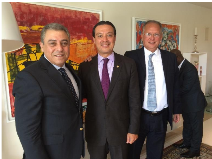
El embajador egipcio, Hazem Khairat (izq.) junto con el embajador Romero y el embajador brasileño, Paulo Meira (der.)

El grupo diplomático abordó temas de interés común en sus labores en Israel. Asimismo, en esta ocasión el anfitrión egipcio compartió sus reflexiones sobre la situación y perspectivas de las pláticas de paz entre Israel y Palestina, lo cual generó un enriquecedor intercambio de opiniones y comentarios.