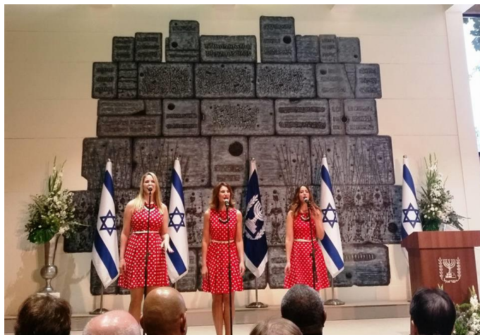
Participación artística durante la recepción de Rosh Hashana