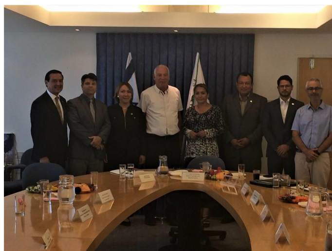
Embajadores del SICA posan junto con el Ministro de Agricultura y Desarrollo Rural, Uri Ariel (cuarto de la izq.), y representantes del ministerio

El 9 de agosto el embajador Werner Matías Romero acompañó a sus colegas de los países del SICA representados en Israel a una visita a las instalaciones del Ministerio de Agricultura y Desarrollo Rural de Israel, localizadas en Rishon-Lezion.