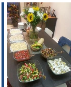
Ensaladas y quesos salvadoreños

Salvadoreños residentes y amigos de El Salvador disfrutaron la historia, cultura y gastronomía cuscatlecas el 5 de agosto en un convivio en la residencia del embajador salvadoreño para celebrar las Fiestas Agostinas, festividades titulares dedicadas al Divino Salvador del Mundo.