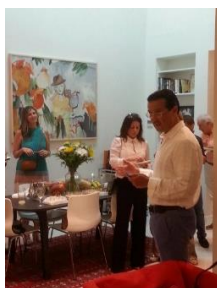
Embajador Romero se dirige a la audiencia

En esta ocasión se degustaron tamales de pollo, pupusas, ensaladas y quesos salvadoreños, así como los refrescos de horchata y cebada.