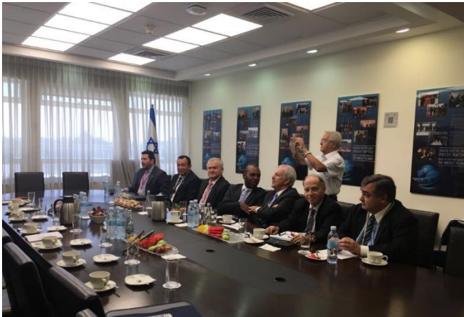
Embajadores y diplomáticos latinoamericanos con MK David Bitan

El 4 de septiembre la embajada de El Salvador se unió a los jefes de misión del grupo latinoamericano para sostener una reunión con el parlamentario David Bitan (Likud), presidente de la coalición de gobierno.