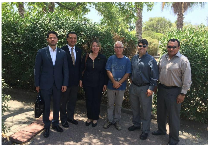
Grupo SICA durante la visita al Departamento de Desarrollo de Poscosecha y Ciencia Alimenticia del Centro Volcani