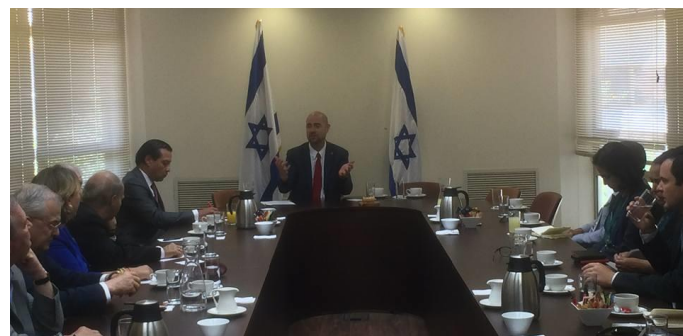
El MK Amir Ohana se dirige a los embajadores latinoamericanos

Durante la reunión, que se realizó gracias a la coordinación de las embajadas de El Salvador y Argentina, los diplomáticos latinoamericanos pudieron discutir e intercambiar abiertamente con el parlamentario israelí sobre diversos temas, tales como la situación y perspectivas del conflicto israelí-palestino, la recientemente aprobada legislación para prohibir el servicio nacional en organizaciones no gubernamentales cuyo financiamiento proviene mayoritariamente de gobiernos extranjeros, la legalización del cánnabis para propósitos médicos y la tenencia de armas por particulares.