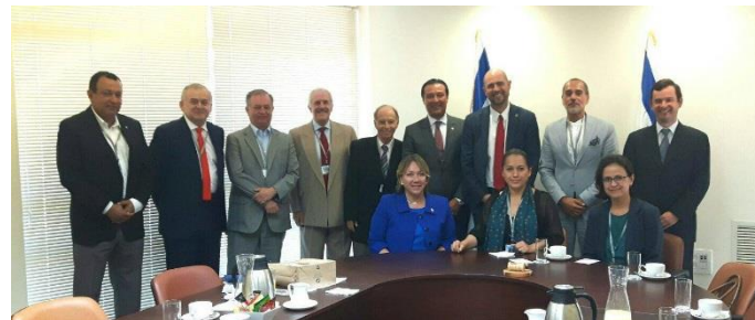
Grupo de embajadores con el parlamentario Amir Ohana