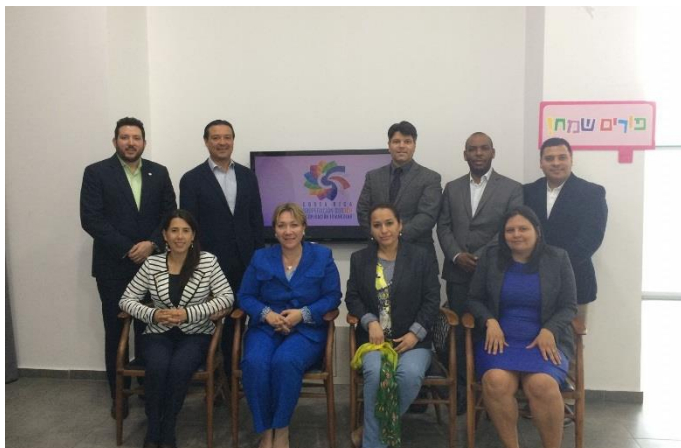
Jefes de misión y representantes de las embajadas de los países miembros del SICA

israelíes, así como la realización de eventos conjuntos para promocionar comercial y culturalmente a la región.