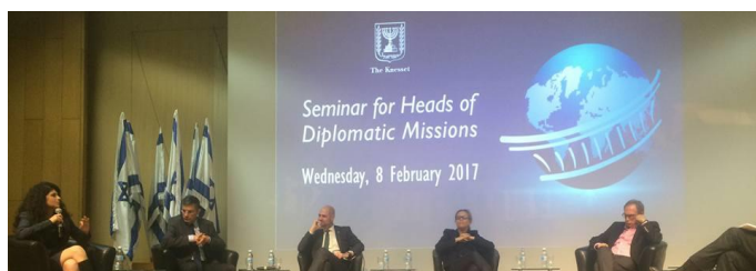
Panelistas durante el seminario para jefes de misiones diplomáticas en la Knesset

El seminario para diplomáticos fue inaugurado por el Vocero del parlamento israelí, Yuli Yoel Edelstein, y durante el mismo se abordaron temas de actualidad como los retos de la diplomacia parlamentaria, los objetivos de desarrollo sostenible de la ONU, la seguridad social en Israel, la legislación para el combate al terrorismo y la recientemente aprobada legislación para legalizar asentamientos israelíes.