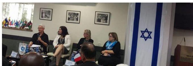
Panel de mujeres diplomáticas en Instituto Golda Meir

El evento contó con un panel titulado “Quebrando la celda de cristal”, en el que participaron S.E. Helene Le Gal, embajadora de Francia ante el Estado de Israel, Rodica Radian-Gordon, subdirectora general de asuntos europeos del Ministerio de Relaciones Exteriores israelí, Ilana Stein, consejera del departamento de Europa central del Ministerio de Relaciones Exteriores de Israel. Asimismo, participó Tamar Eshel, diplomática, ex miembro del parlamento israelí y representante de Israel ante las Naciones Unidas, una mujer de 97 años de edad quien después del establecimiento de Israel en 1948 comenzó a trabajar para el Ministerio de Relaciones Exteriores.