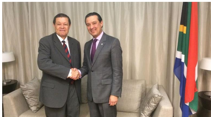
Embajador Romero durante su encuentro con el vicescanciller sudafricano, Luwellyn Landers