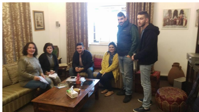
Miembros de la comunidad salvadoreña residentes en Belén