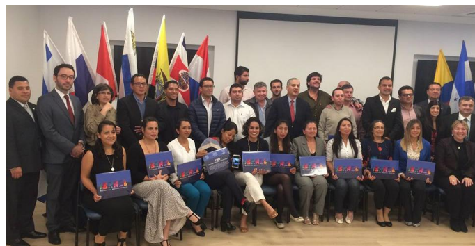
"Foto de familia" de becarios y diplomáticos latinoamericanos con funcionarios de MASHAV

De esta capacitación se beneficiaron 25 becarios de doce países latinoamericanos, quienes durante dos semanas conocieron los avances israelíes en el sector agrícola, así como formas innovadoras de desarrollar dicho sector.