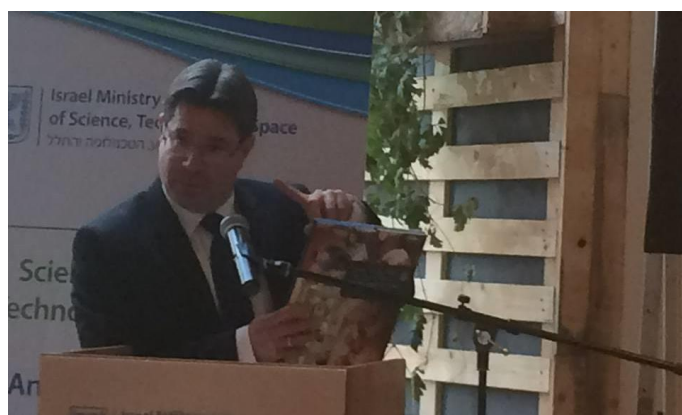
Ministro Ofir Akunis se dirige a la audiencia