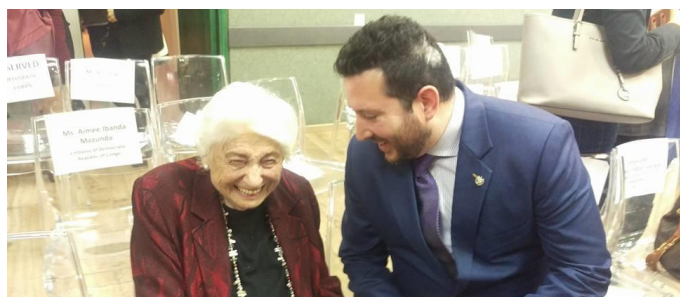
El ministro consejero Diego Dalton conversa con la ex diplomática israelí, Tamar Eshel

En el marco de la celebración del Día Internacional de la Mujer (8 de marzo), esta embajada participó el 1 de marzo en el evento Women in Diplomacy que se llevó a cabo en el Instituto de Capacitación Golda Meir, el cual forma parte de la red de institutos de la agencia de cooperación del Ministerio de Relaciones Exteriores israelí, MASHAV. El director de MASHAV, Gil Haskel, junto con la directora del Instituto Golda Meir, Hava Karrie, presidieron el seminario, valorando y reconociendo el trabajo de las mujeres en la diplomacia.