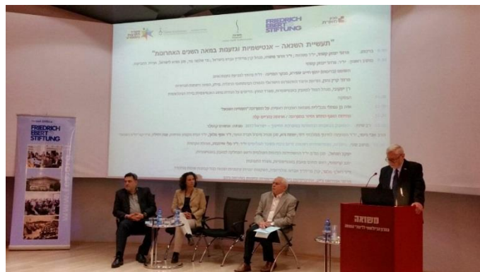
Grupo de panelistas durante la conmemoración del Día de la Eliminación de la Discriminación Racial en el Instituto Massuah

La Embajada de El Salvador en Israel, concurrente con Sudáfrica, honró la conmemoración de esta fecha con su participación en el seminario sobre antisemitismo y racismo durante el siglo pasado organizado por el Instituto Massuah.