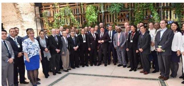
Foto de grupo del Ministro Akunis con embajadores y diplomáticos asistentes a la conferencia de Ciencia y Tecnología

El embajador Werner Matías Romero participó el 16 de marzo participó en la Conferencia Diplomática de Ciencia 2017, organizada por Ministerio de Ciencia, Tecnología y Espacio de Israel. Al evento se dieron cita los embajadores y diplomáticos de la mayoría de representaciones acreditadas ante Israel.