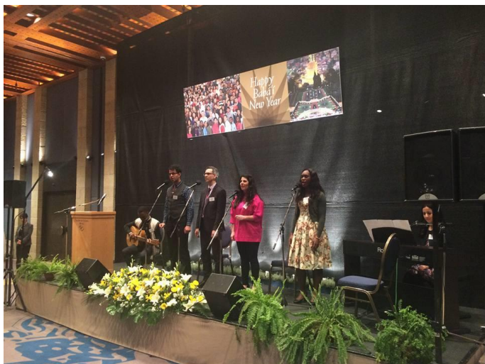
Intervención artística durante la celebración de Naw-Rúz

El 22 de marzo la embajada de El Salvador se unió a la celebración de Naw-Rúz, el Año Nuevo Bahá'í, en Jerusalén. El centro espiritual y administrativo de la Fe Bahá'í tiene su sede en Haifa (Israel). La Comunidad Bahá'í en El Salvador es muy activa en el desarrollo comunitario y espiritual de los salvadoreños. ¡Feliz Naw-Rúz!