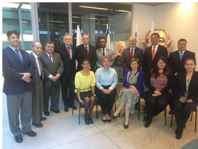
Jefes de misiones diplomáticas de Latinoamérica en el Centro Peres para la Paz