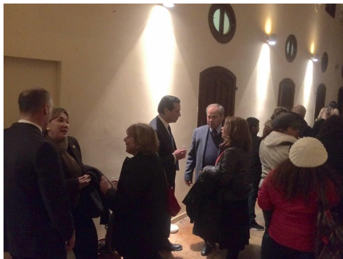
Asistentes a la celebración del aniversario de la firma de los Acuerdos de Paz durante el convivio

Luego de la celebración eucarística, se realizó un convivio con los asistentes al evento.