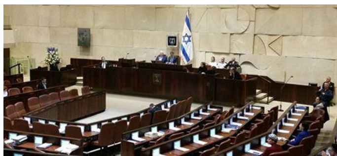
Parlamento de Israel (la Knesset)

En la sesión plenaria de celebración se contó con la participación del Presidente de Israel, Reuven Rivlin, el Vocero de la Knesset, Yuli-Yoel Edelstein, la Presidenta de la Corte Suprema de Justicia de Israel, Miriam Naor, el Controlador del Estado, Yosef Shapira, el Ministro de Turismo (como representante del gobierno de Israel), Yariv Levin, el líder de la oposición, Isaac Herzog, y miembros del cuerpo diplomático acreditado en Israel.