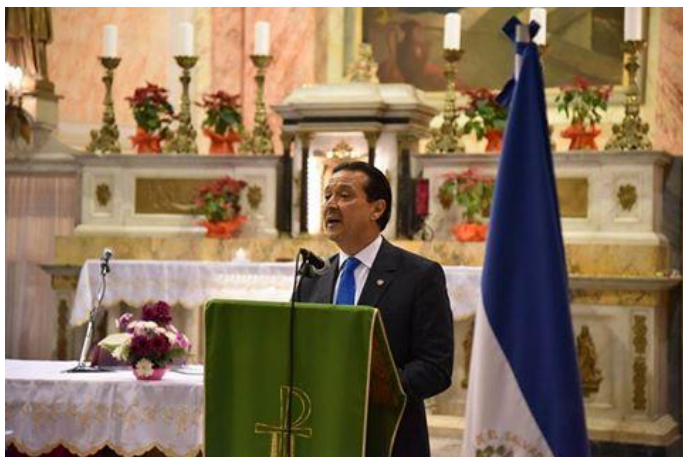
Embajador Romero dirige palabras alusivas a la celebración en la Iglesia de San Pedro en Jaffa

Para conmemorar el 25° Aniversario de los Acuerdos de Paz, el sábado 14 de enero la embajada de El Salvador en Israel, en colaboración con el padre Agustín Pelayo de la Iglesia de San Pedro en la ciudad vieja de Jaffa, Tel Aviv, organizó la celebración de una misa de acción de gracias en dicho santuario. Al servicio asistieron más de setenta personas, entre ellas miembros de la comunidad salvadoreña residente en Israel, embajadores y diplomáticos iberoamericanos, funcionarios de la cancillería israelí y amigos de El Salvador.