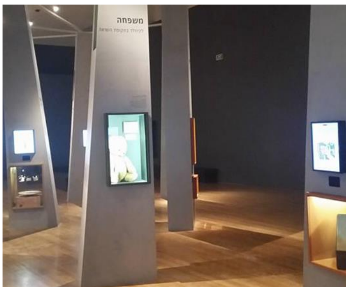
Vista de una de las salas de la exposición sobre los niños en el Holocausto en el museo Yad Vashem

Luego del acto, los asistentes fueron invitados a recorrer una colección temporal de Yad Vashem enfocada en su totalidad a los niños durante el Holocausto. La emotiva exhibición contiene diversas exposiciones que describen el sufrimiento de los niños durante el Holocausto y sorprendentemente la esperanza en un futuro con paz y tolerancia. La exhibición representa árboles sin ramas que significan cada vida terminada prematuramente.