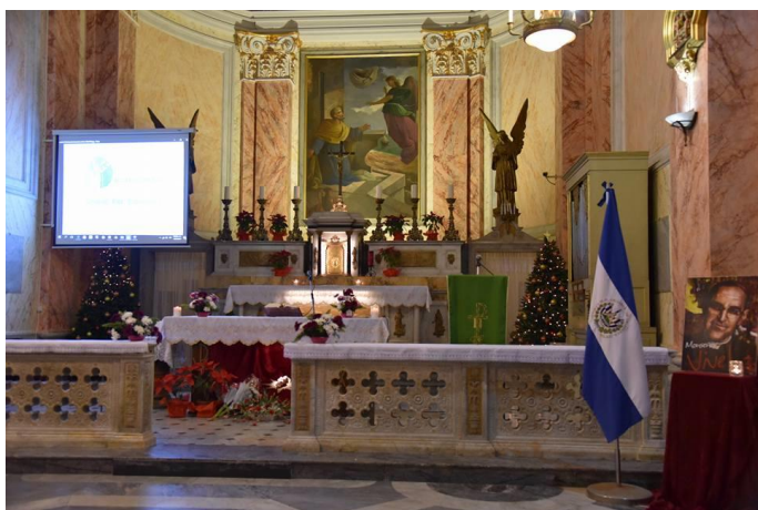
Altar de la Iglesia de San Pedro en Jaffa, Tel Aviv

“Nada puede redimir la muerte y la destrucción que la guerra dejó hace 25 años”, continuó diciendo, “pero de esa experiencia resultó un documento de paz y reconciliación política que puede servir de ejemplo a otros países a encontrar una salida a su conflicto civil, y además el recuerdo y legado inquebrantable de un peregrino de la fe y la alegría, Monseñor Romero”.