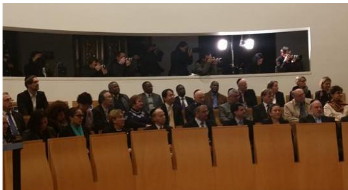
Representantes del cuerpo diplomático durante el acto recordatorio del Día Internacional de las Víctimas del Holocausto

acto solemne fue presidido por el Primer Ministro, Benjamín Netanyahu, y contó con la participación de miembros del cuerpo diplomático acreditado en Israel.