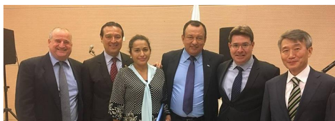
Embajadores latinoamericanos con el ministro Akunis y el embajador coreano

El 30 de octubre el embajador Werner Matías Romero junto a otros embajadores latinoamericanos sostuvieron un encuentro con el ministro de Ciencia, Tecnología y Espacio de Israel, el parlamentario Ofir Akunis, en ocasión de la celebración del Día Nacional de Corea ofrecida por el embajador surcoreano S.E. Lee Gun-tae.