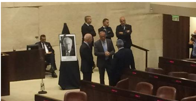
Retrato del recordado primer ministro Isaac Rabin en el plenario de la Knesset