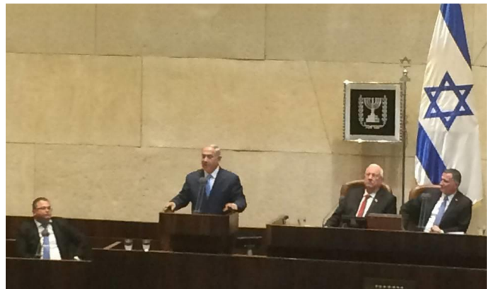
El primer ministro de Israel, Benjamin Netanyahu, durante la sesión de apertura de la Knesset

La ceremonia fue presidida por el vocero de la Knesset, Yuli Yoel Edelstein, y en la misma pronunciaron discursos alusivos el presidente Reuven Rivlin, el primer ministro Benjamin Netanyahu y el líder de la oposición Isaac Herzog.