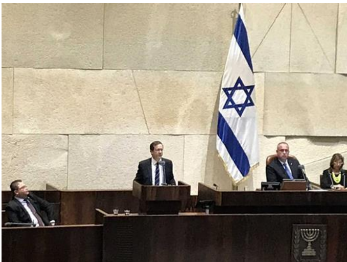
El líder de la oposición, Issac Herzog, durante su intervención