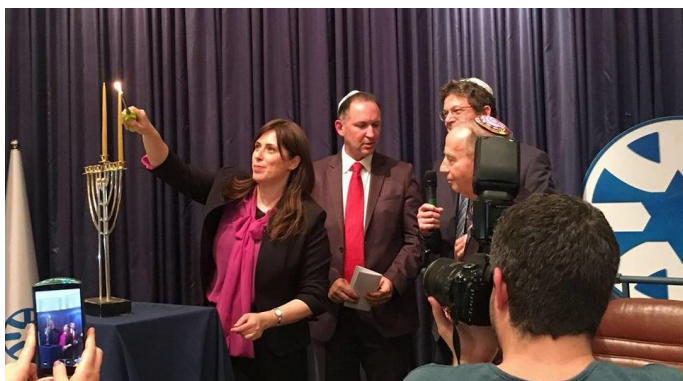
La vicecanciller israelí Tzipi Hotovely durante el encendido de la primera vela de Jánuca

A lo largo de los años MASHAV ha contribuido al desarrollo de El Salvador a través de programas de capacitación y asistencia técnica que han beneficiado a miles de salvadoreños y sus comunidades.