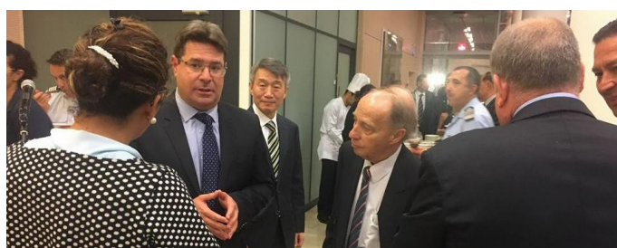
Embajadores con el ministro y parlamentario Ofir Kunis

El 30 de octubre el embajador Werner Matías Romero junto a otros embajadores latinoamericanos sostuvieron un encuentro con el ministro de Ciencia, Tecnología y Espacio de Israel, el parlamentario Ofir Akunis, en ocasión de la celebración del Día Nacional de Corea ofrecida por el embajador surcoreano S.E. Lee Gun-tae.