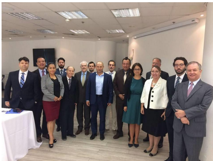
Embajadores y representantes de las embajadas latinoamericanas con ministro de Educación, Naftali Bennett (centro, de traje azul)

Los diplomáticos latinoamericanos pudieron escuchar la visión del ministro Bennett en muchos temas de la agenda doméstica e internacional en Israel, así como también intercambiar opiniones sobre temas actuales y maneras de fomentar la cooperación entre la región latinoamericana e Israel.