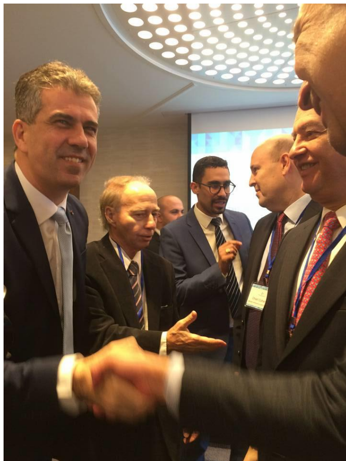
El ministro de Economía e Industria de Israel, Eli Cohen, saluda al embajador Romero