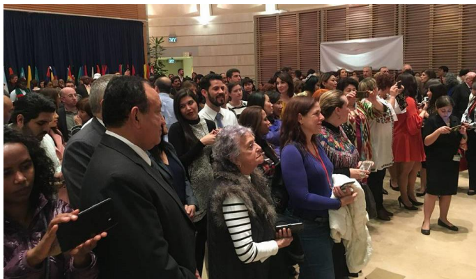
Audiencia en la celebración del aniversario de MASHAV