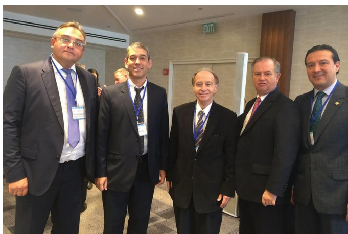
Embajador Romero con el director general del ministerio de Economía e Industria, Shay Rinsky, y los embajadores de Ucrania, Paraguay y México

El embajador Romero tuvo la oportunidad de dialogar con el ministro y otros funcionarios comerciales israelíes sobre el potencial de comercio e inversión entre El Salvador e Israel.