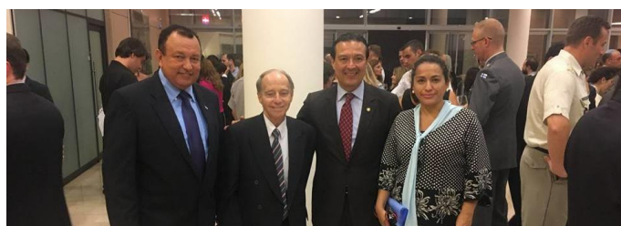
De izq. a der., embajadores de Honduras, Paraguay, El Salvador y Panamá