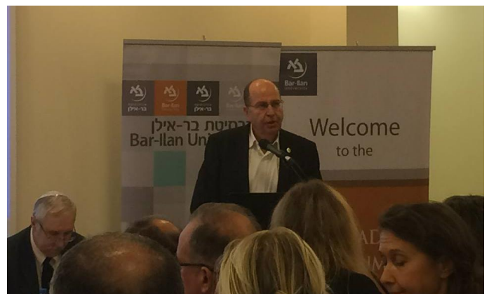
El ex ministro de Defensa Moshe (Bogie) Ya'alon se dirige a la audiencia