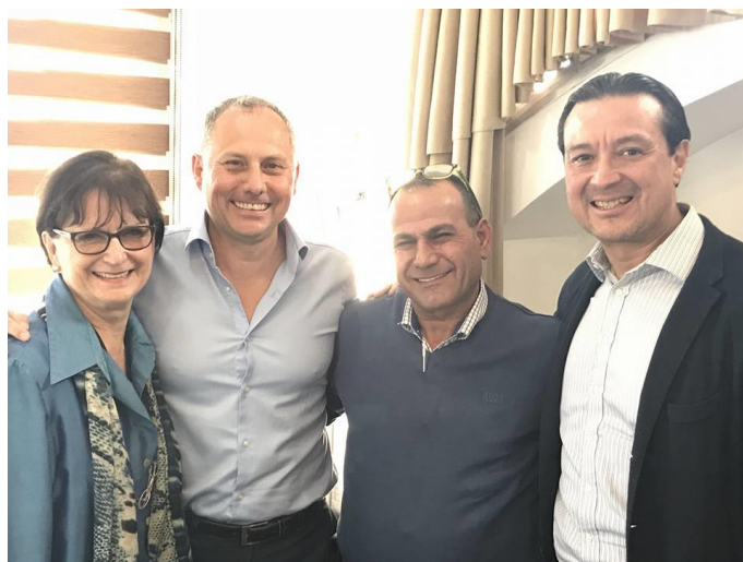
Embajador Romero con vicealcalde de Shibli-Umm al-Ghanem (segundo de la derecha) y embajadores de Canadá y Hungría

El embajador Werner Matías Romero tuvo la oportunidad de visitar el 28 de noviembre el pueblo beduino de Shibli-Umm al-Ghanem en la Baja Galilea en el norte de Israel, en donde, junto a otros embajadores y diplomáticos, sostuvo encuentros con el alcalde de ese municipio y con otros funcionarios municipales para aprender sobre la historia de los beduinos y los proyectos de desarrollo local de la región, así como explorar sinergias y formas de cooperación con nuestro país.