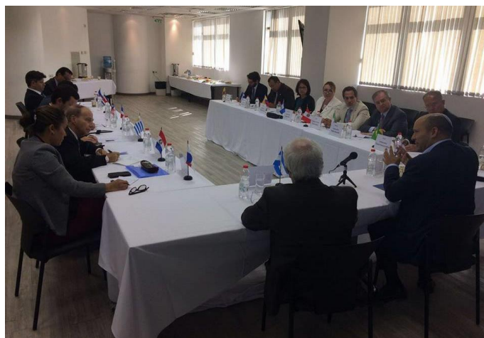
El ministro Bennett con el grupo de embajadores latinoamericanos

Israel, así como buscar el fomento de la cooperación de Israel con los países de la región.