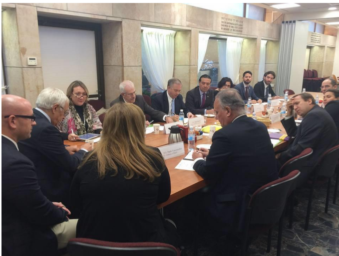
Embajadores y representantes de las embajadas latinoamericanas en el Instituto Truman