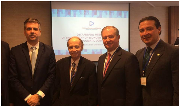
De izq. a der.: ministro de Economía e Industria de Israel, Eli Cohen, y embajadores de Paraguay, México y El Salvador