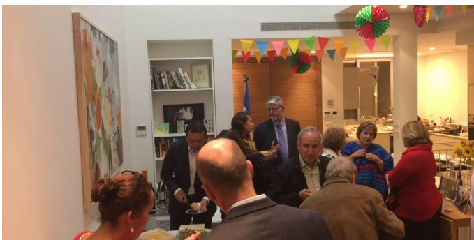
Asistentes a la celebración

Además, la residencia de El Salvador se vistió con decoraciones de papel picado elaboradas por artesanos del barrio San Miguelito de San Salvador.