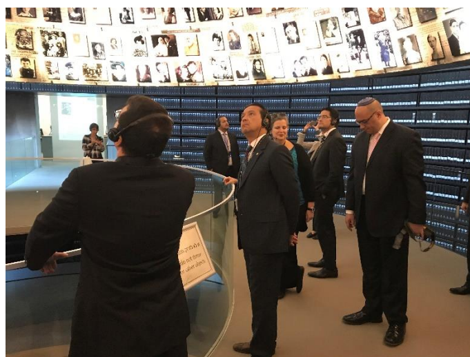
Embajador Romero en el Salón de los Nombres