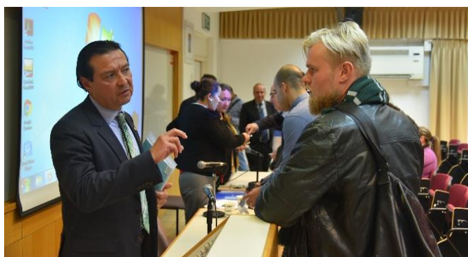
Embajador Romero conversa con un estudiante de la TAU

La TAU es hoy en día la más grande y más completa institución de educación superior universitaria en Israel, con más de 30,000 estudiantes distribuidos en nueve facultades, 29 escuelas y 98 departamentos. A 50 años de su fundación, la TAU es una universidad reconocida a nivel mundial, lo que demuestra su poder de visión y dedicación.