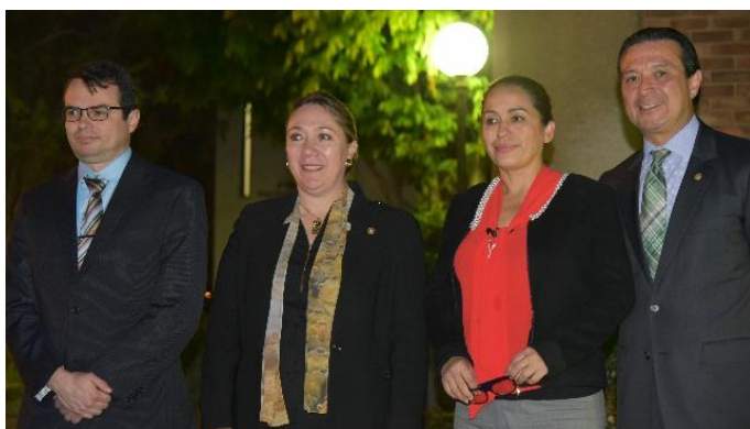
De izq. a der., encargado de negocios de Costa Rica, y embajadores de Guatemala, Panamá y El Salvador

Durante la sesión de preguntas y respuestas, los estudiantes se mostraron interesados en conocer más sobre los esfuerzos regionales para enfrenar los desafíos de seguridad, así como la migración de centroamericanos, los retos ambientales del Corredor Seco centroamericano, y el objetivo final de la integración centroamericana, entre otros temas.