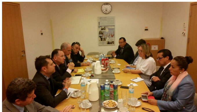
Embajadores de los países miembros del SICA en su reunión con funcionarios de la cancillería israelí y MASHAV

El propósito del encuentro fue revisar los programas actuales de cooperación técnica, así como explorar las perspectivas futuras de cooperación a nivel regional y bilateral. Los embajadores del SICA agradecieron a MASHAV la asistencia oportuna y diversa que hasta ahora se ha recibido de Israel.