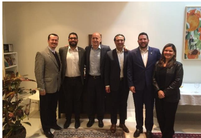
Equipo de la embajada salvadoreña en Israel

La comunidad salvadoreña se mostró muy agradecida por el agasajo y los invitados no salvadoreños apreciaron la hospitalidad cuscatleca.