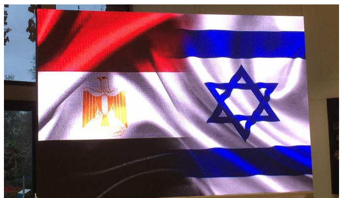
Banderas de Egipto e Israel