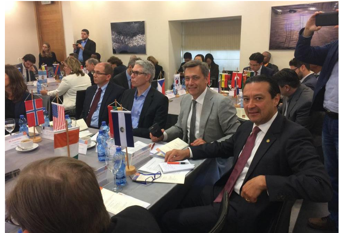
Embajador Romero junto al embajador de Lituania

Este año el foro se centró en la celebración del 70° aniversario de la resolución de la ONU sobre la partición del Mandato Palestino.