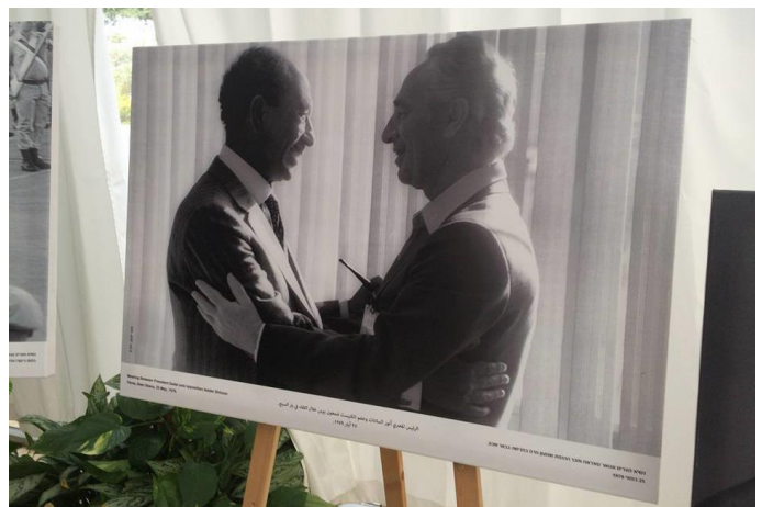
Foto alusiva del presidente egipcio Anwar Sadat y el líder de la oposición israelí de ese entonces, Shimon Peres

El acto conmemorativo, que se realizó en la residencia del presidente israelí en Jerusalén, contó con palabras alusivas del presidente Reuven Rivlin y del embajador egipcio en Israel, S.E. Hazem Khairat.