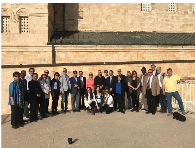
Foto de familia del grupo diplomático en la Basílica de la Transfiguración