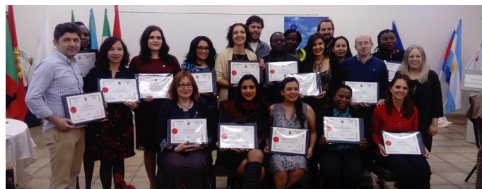
Foto de familia de becarios con docentes del Centro Ofri