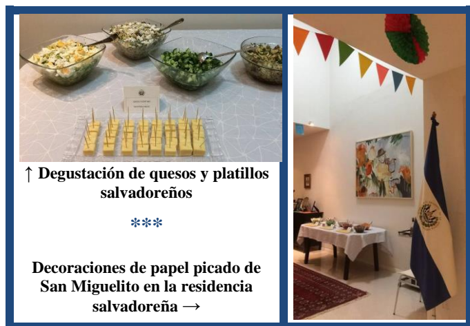
↑ Degustación de quesos y platillos salvadoreños

En dicha ocasión se degustaron exquisitos platillos típicos, entre ellos las tradicionales pupusas, tamales de pollo, quesos salvadoreños, quesadilla y semita, así como ron salvadoreño.