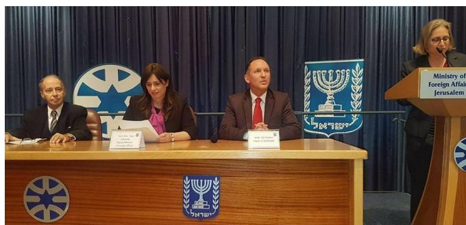
Autoridades de la cancillería israelí y el embajador de Paraguay (decano del GRULA) durante la ceremonia de MASHAV