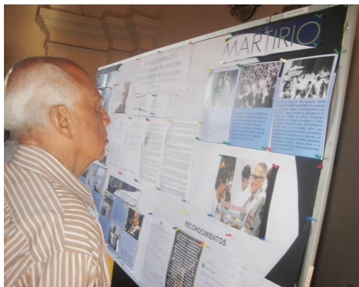
Feligres apreciando Mural Biográfico de Monseñor Romero