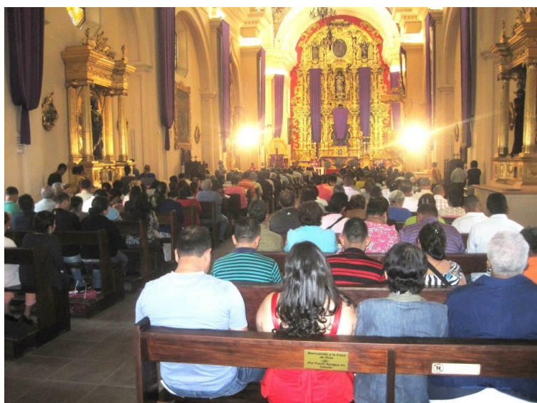
Misa en Catedral de Tegucigalpa

A la misa concurrió un aproximado de 300 personas incluyendo al personal de esta Embajada.