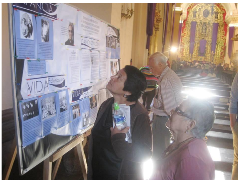
Feligreses apreciando Mural Biográfico de Monseñor Romero