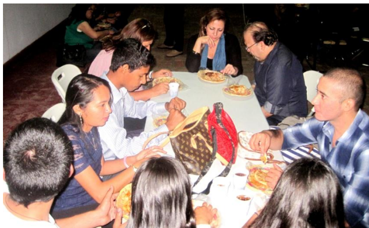
Salvadoreños departiendo durante el evento