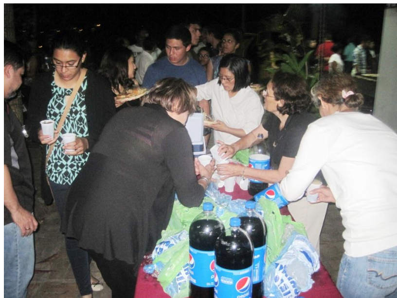
Salvadoreños departiendo durante el evento