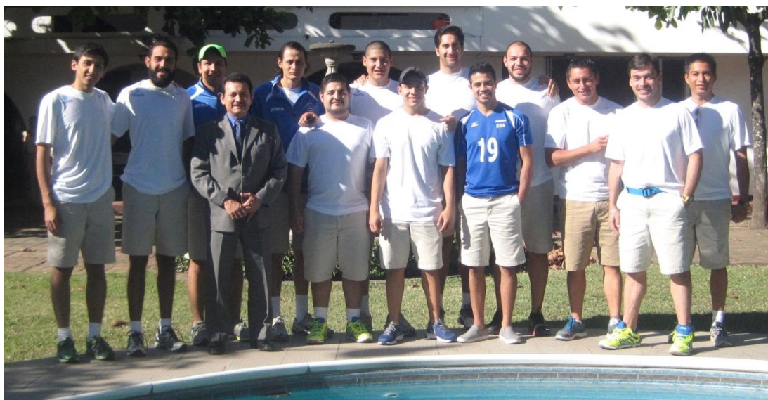
Embajador Carlos Pozo, junto a jóvenes deportistas salvadoreños

El Señor Embajador Carlos de Jesús Pozo, recibió en la sede de la Embajada de El Salvador en Honduras, el pasado 8 de diciembre, a una delegación de 14 miembros del equipo de volibol masculino salvadoreño, que llegaron a Tegucigalpa a participar en el XVIII Copa Centroamericana Mayor masculina.