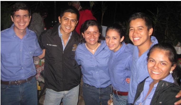
Jóvenes estudiantes durante el convivio

La actividad finalizó con la degustación de pupusas y bebidas, que en ocasión del encuentro se llevó para compartir con todos los asistentes.