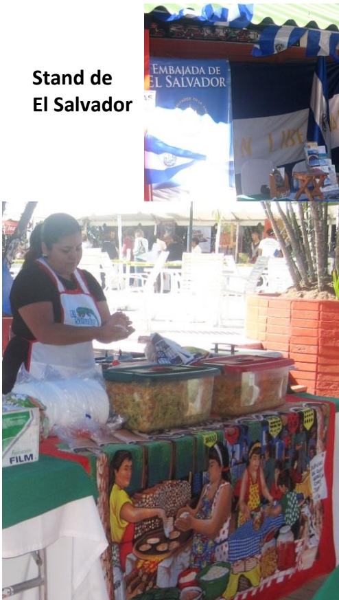
Stand de El Salvador

La Embajada de El Salvador participó el domingo 7 de diciembre del presente año, en el XXI Festival de Países Unidos para Dar, organizado por el Arca de Honduras, organización dedicada a fines altruistas enfocada en ayudar a personas discapacitadas. El evento consistió en un Festival Gastronómico Internacional, en donde se participó instalando un Stand salvadoreño, conteniendo información turística, típica y gastronómica, en donde se repartieron brochures turísticos y culturales, así mismo se tenían deliciosas pupusas para los asistentes, destinando las ventas a dicha organización benéfica.