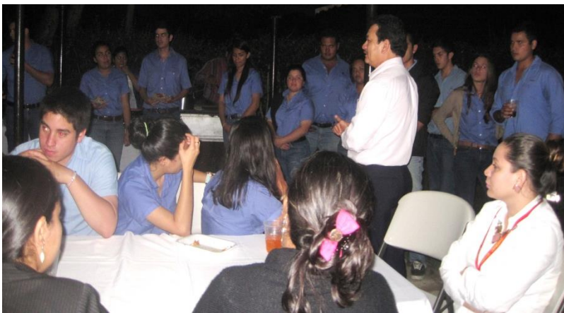
Embajador Pozo dando palabras a los estudiantes

El pasado 4 de diciembre del presente año la Embajada de El Salvador en Honduras, participó en el 44 Salón de Arte Miniaturas Centroamérica y el Caribe, realizado por el Instituto Hondureño de Cultura Interamericana y Banco Atlántida, en el que se destacaron las obras de artistas de diferentes países incluyendo El Salvador, los cuales sobresalieron por plasmar técnicas, dibujos y colores con gran contenido interpretativo, resaltando la cultura salvadoreña.