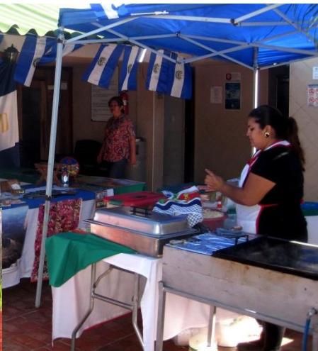
Estación de pupusas