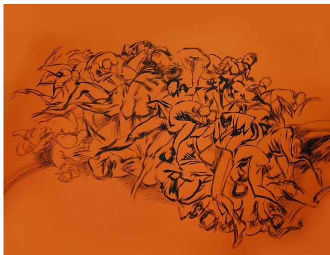
El Mozote, 1981

El 22 de abril, a las 6 p.m., estaremos inaugurando la muestra de dibujo “Razón Paradójica: La Línea” del distinguido artista salvadoreño Héctor Hernández. El evento se realizará en la sede del Centro de Arte y Cultura de la Universidad Nacional Autónoma de Honduras (CAC-UNAH), ubicado en Comayagüela. Hernández, también desarrollará un Taller de Expresión Gráfica el día lunes 25 de abril, de 8:00 a.m. a 1 p.m., en la sede del CAC-UNAH.