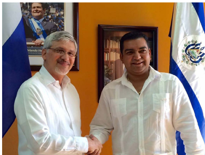
Embajador Juan José Figueroa Tenas y el Alcalde de Siguatepeque, Juan Carlos Morales.

El 20 de abril, se firmará un Convenio de Hermanamiento entre las Municipalidades de Panchimalco, El Salvador y Siguatepeque, Honduras, en el marco de la clausura del “V Simposio de Escultura en Piedra” en Siguatepeque.