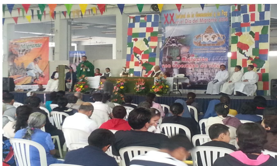
Celebración de la Misa, en el Día del Migrante

El día domingo 7 de septiembre 2014, La Embajada de El Salvador en Guatemala participó en la Conmemoración del Día del Migrante, la actividad se llevó a cabo en el Parque de la Industria de Ciudad de Guatemala. La actividad tuvo por objeto el reflexionar sobre las personas que transitan con rumbo