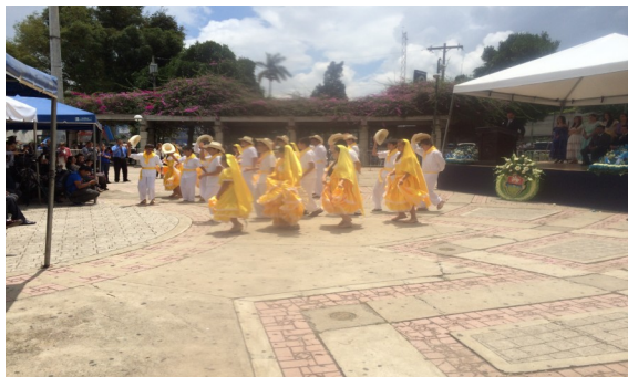
Grupo de Danza folklórica bailado "adentro Cojutepeque" y el "Torito Pinto"

de El Salvador y Escuela Alberto Masferrer de Ciudad de Guatemala y Comunidad Salvadoreña residente en Guatemala. El evento estuvo colorido ya que fue amenizado por Bandas de Paz de Guatemala y Grupos de danza folklórica que vestían de trajes típicos de la región, y que deleitaron a los presentes con danzas tradicionales como son "adentro Cojutepeque", "Torito pinto". También se colocó una ofrenda floral por cada uno de los Embajadores. Al finalizar el evento se compartió un refrigerio con todos los presentes.