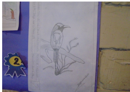
2do. Lugar "El Torogoz"