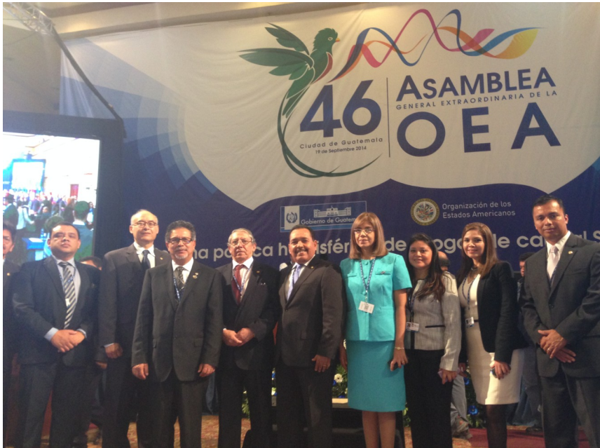
Viceministro Lic. Carlos Castaneda y Embajador Jorge Palencia junto a la Delegación de El Salvador en la 46 Asamblea OEA en Guatemala

El día 19 de septiembre se realizó en la capital de Guatemala la XLVI Asamblea General Extraordinaria de la Organización de Estados Americanos (OEA), la cual reunió a 32 de los 34 países miembros, con el objetivo de analizar y compartir criterios sobre las drogas en América, con el propósito de que el continente consensue una posición respecto a la Asamblea General de las Naciones Unidas de 2016.