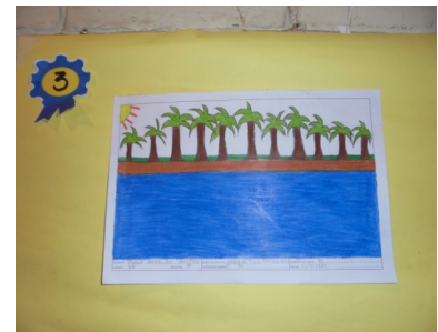
3er. Lugar "Playa El Cuco"