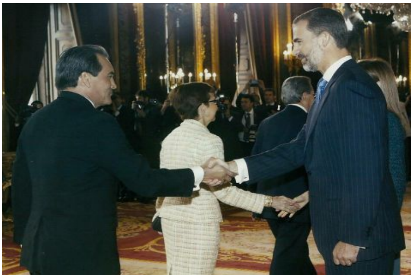
Saludo del Embajador Benítez al rey Felipe IV.

Posterior a esos actos, se realizó la tradicional recepción conmemorativa del Día de la Fiesta Nacional que tuvo lugar en el Salón del Trono del Palacio Real de Madrid, con la asistencia de representantes de la sociedad española, incluyendo el cuerpo diplomático acreditado en España.