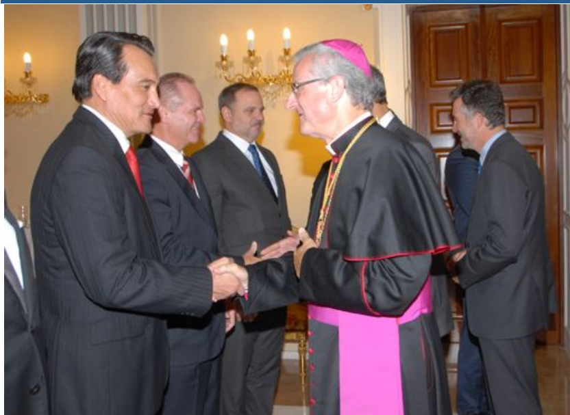
El embajador Benítez durante el saludo que el cuerpo diplomático dirige al Copríncipe Episcopal de Andorra, Obispo Joan-Enric Vives.