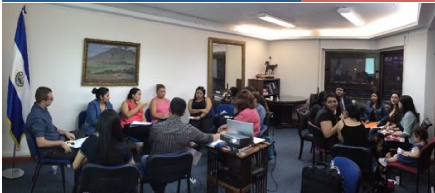
Diferentes momentos que tuvieron lugar durante la jornada de la Consulta Ciudadana realizada en la sede de la embajada y en la que participó, de forma muy activa y dinámica, la comunidad residente en Madrid.