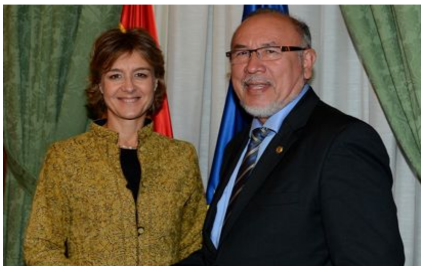
Aparecen: La ministra de Agricultura, Alimentación y Medio Ambiente, Isabel García Tejerina con el Ministro de Agricultura y Ganadería, Orestes Orteza Andrade.