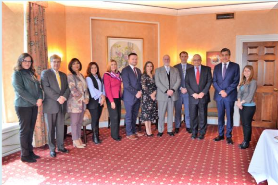
Embajadores y representantes del GRULA