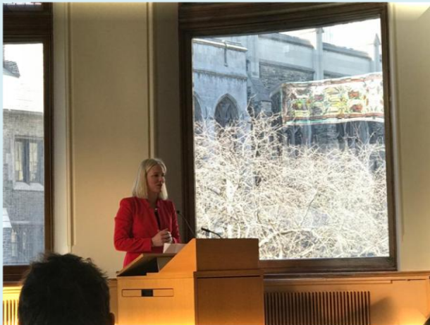
Ministra de Medio Ambiente y Cambio Climático de Canadá Dirigiéndose al público asistente en la Conferencia “No Planet B: Hope in a Fragile World”