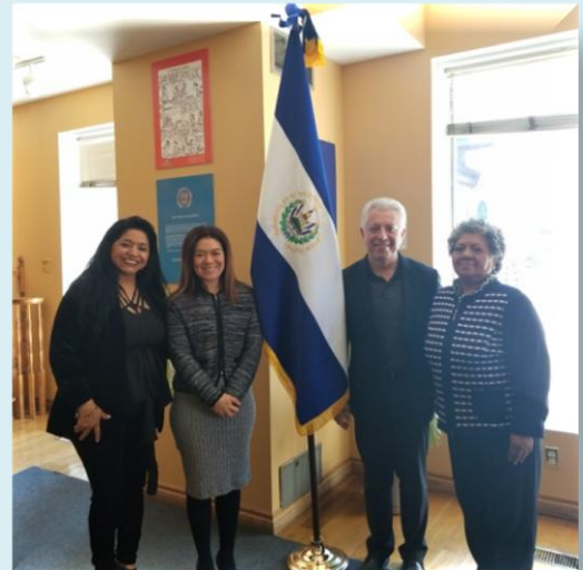
Miembros de la Cámara de Comercio Salvadoreña de Québec y representantes de la Embajada de El Salvador, durante la reunión de trabajo