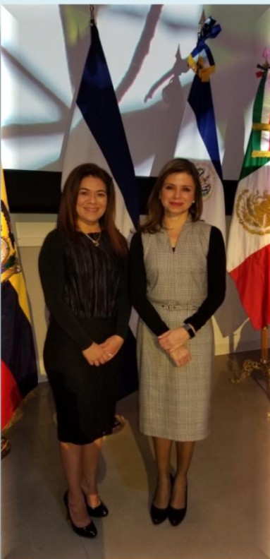
Fotografía Oficial Representantes del Grupo de Países Latinoamericano (GRULA)