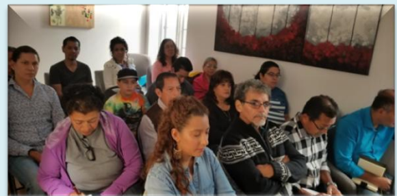
Representantes de Organizaciones Salvadoreñas y Líderes Comunitarios, que atendieron la convocatoria de esta Representación Diplomática y Consular