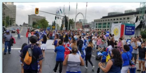
Jóvenes de la Comunidad Salvadoreña junto al grupo de Danza Xochitl y asistentes al desfile