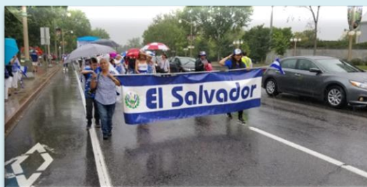
Niñas y niños, jóvenes y adultos disfrutaron del desfile con fervor cívico, llevando los colores de nuestra bandera.