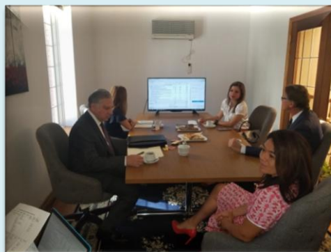
Foto: Embajadores durante la reunión para la organización del 197 Aniversario de la Independencia de los países de Centroamérica