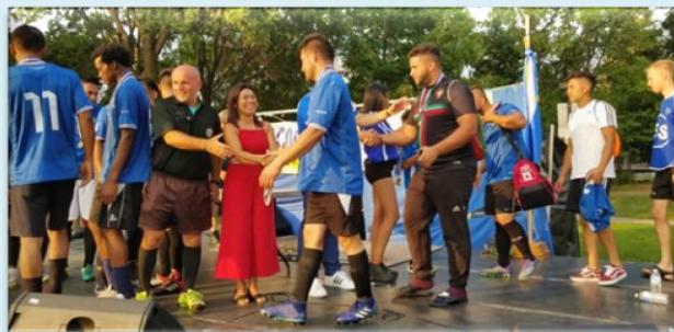
Embajadora entrega medallas al equipo salvadoreño, quienes fueron los ganadores del Torneo de Fútbol realizado durante el Festival.