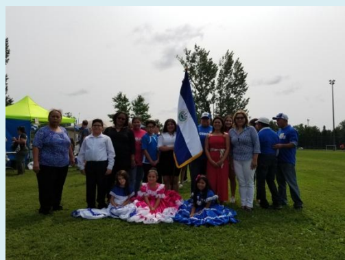
Grupo de danza Xochilt con la Viceministra para los Salvadoreños en el Exterior, la Embajadora de El Salvador en Canadá y la Cónsul de El Salvador en Toronto.