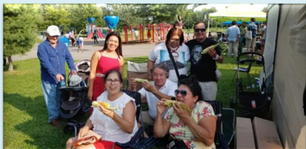
Embajadora comparte un momento alegre con los representantes de la Fundación Romero de Montreal.