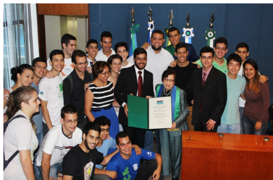
Estudiantes de Medicina de la Universidad de Brasilia

"Queremos firmar un pacto de generaciones. El desafío de consolidar el derecho universal a la Salud, de transformar la educación médica. [...]"