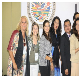
Ministra Consejera durante la participación de la IV Reunión de Autoridades Nacionales en Materia de Trata de Personas Brasilia, Brasil

La Embajada del El Salvador en Brasil, participó en el IV Reunión de Autoridades Nacionales en Materia de Trata de Personas, realizada los días 4 y 5 de Diciembre, realizadas en Brasilia.