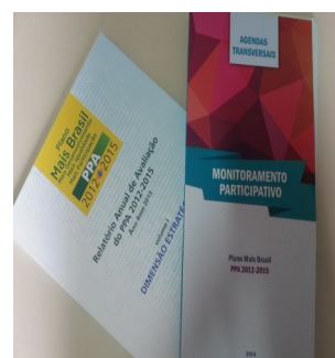
V Foro Interconsejos del Ministerio de Planificación, Presupuesto y Gestión Brasília, Brasil

El Ministerio de Planificación, Presupuesto y Gestión, por su parte, y como iniciativa de cooperación sur—sur; ha manifestado, tener el interés de compartir las buenas prácticas con aquellos países que lo manifiesten.