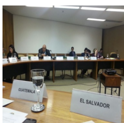
I Reunión del Grupo de Trabajo sobre Afrodescendientes de la Comunidad de los Estados Latinoamericanos CELAC