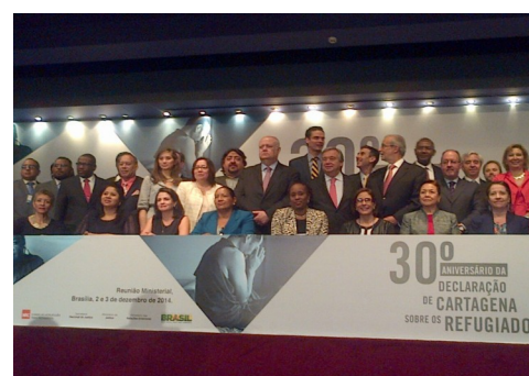
Foto Oficial de la reunión Ministerial Cartagena + 30 Brasilia, Brasil