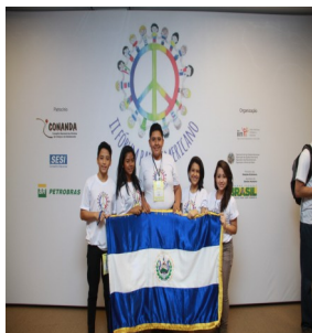
Grupo de Niños, Niñas y Adolescentes de El Salvador que participaron del Foro Panamericano