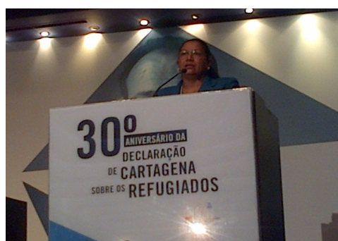
Liduvina del Carmen Magarin de Esperanza Viceministra de Salvadoreños en el Exterior

desplazadas, y apátridas en América Latina y el Caribe dentro de un marco de cooperación y solidaridad.