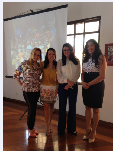
Equipo de la Embajada de El Salvador en Brasilia