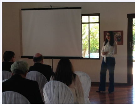
Embajadora Vanegas durante su intervención