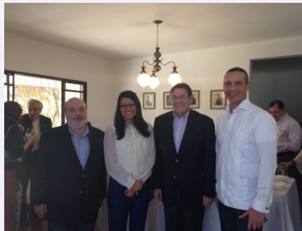
Con los Embajadores de Uruguay, Chile y República Dominicana, quienes también se unieron a la celebración.