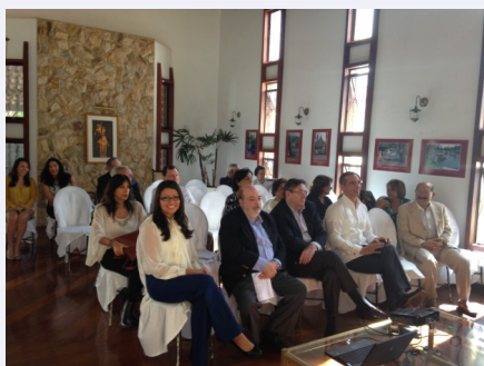
Participantes a la transmisión en directo de la misa de Beatificación