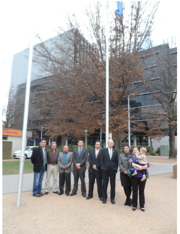
Izamiento de la Bandera Salvadoreña, Plaza Latinoamérica, Canberra, 12 de Septiembre de 2014. Miembros de las Embajadas Latinoamericanas y España en Canberra, funcionarios del Departamento de Relaciones Exteriores y Comercio (DFAT) y de la comunidad salvadoreña en Canberra

Adicionalmente, en horas de la noche, la Embajada organizó una Recepción con motivo de la Independencia, así como una presentación del Grupo de Música y Danza Tradicional Salvadoreñas, Sendas Salvadoreñas, de Sídney.