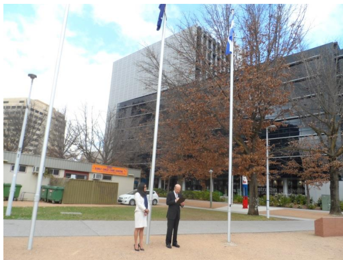
Izamiento de la Bandera Salvadoreña, Plaza Latinoamérica, Canberra, 12 de Septiembre de 2014