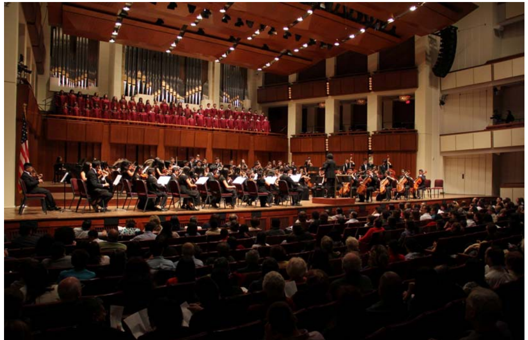
Coro y Orquesta Sinfónica Juvenil Polígono Don Bosco se presenta en Kennedy Center, Washington D.C.