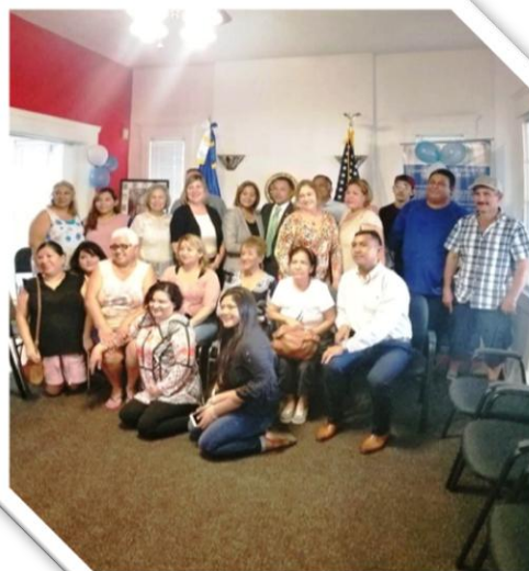
TORNEO DE INDEPENDENCIA, PARTICIPACION DE EQUIPOS DE FUT BOLL, DE EL SALVADOR, GUATEMALA, HONDURAS Y MEXICO. EN TUCSON ARIZONA