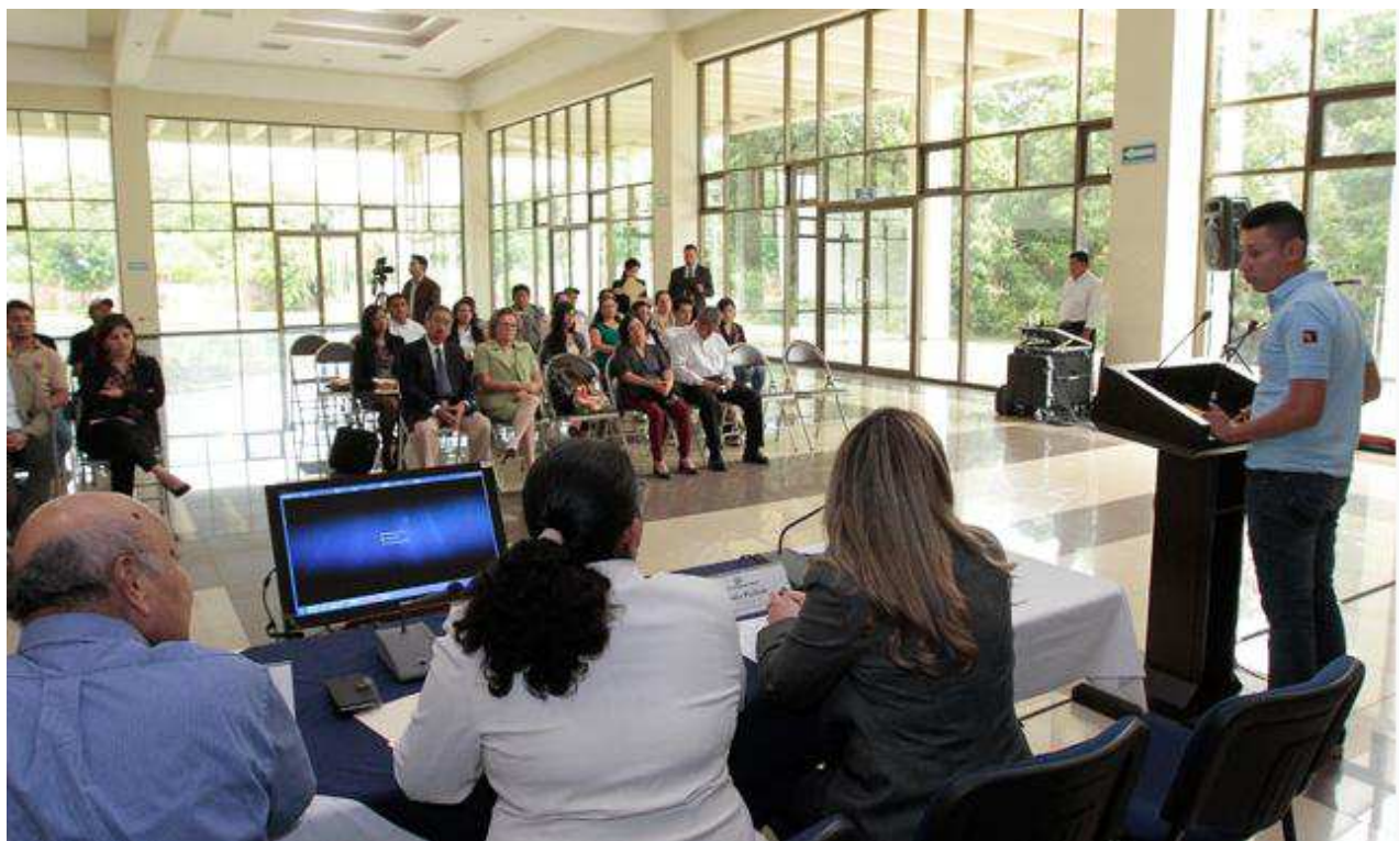
Representante de Jóvenes emprendedores salvadoreños otorgando palabras de agradecimiento