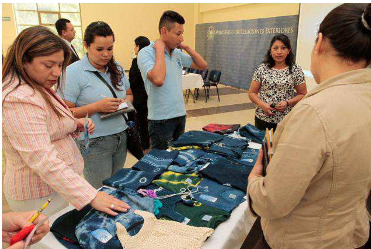
Jóvenes emprendedores asistentes al acto de entrega.