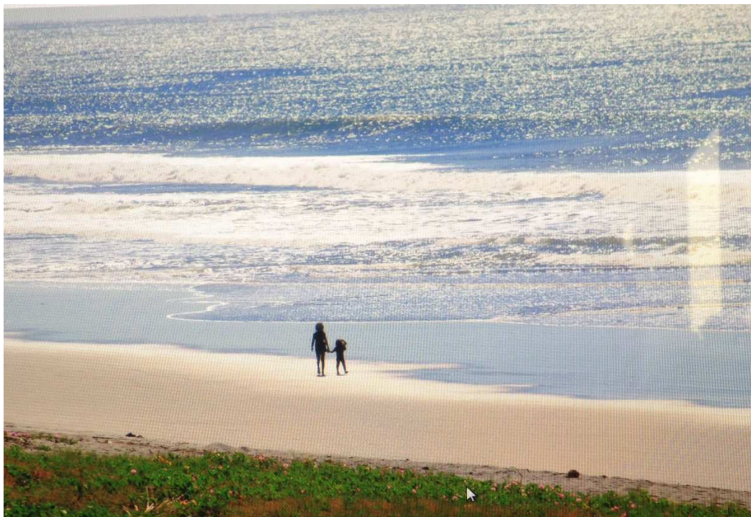
Vista de Playa El Amatal frente al Hotel Oasis Azul.