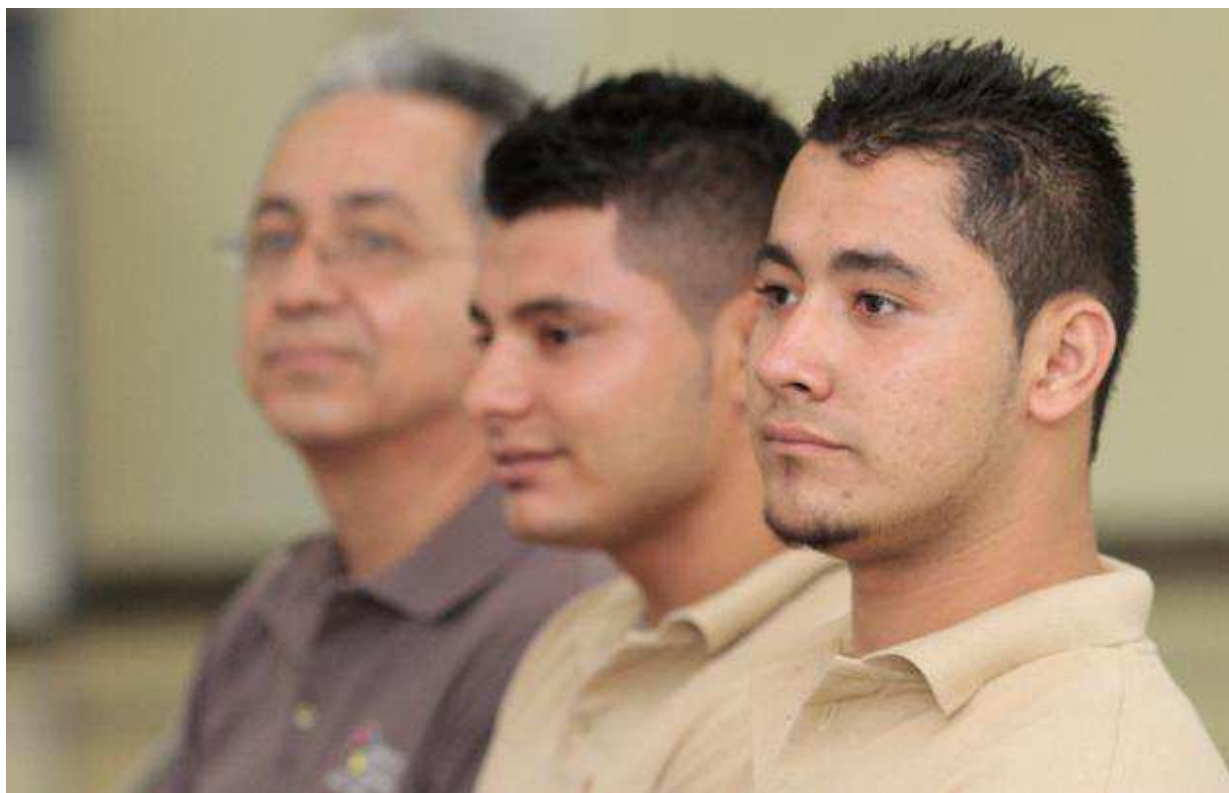
Jóvenes emprendedores asistentes al acto de entrega.