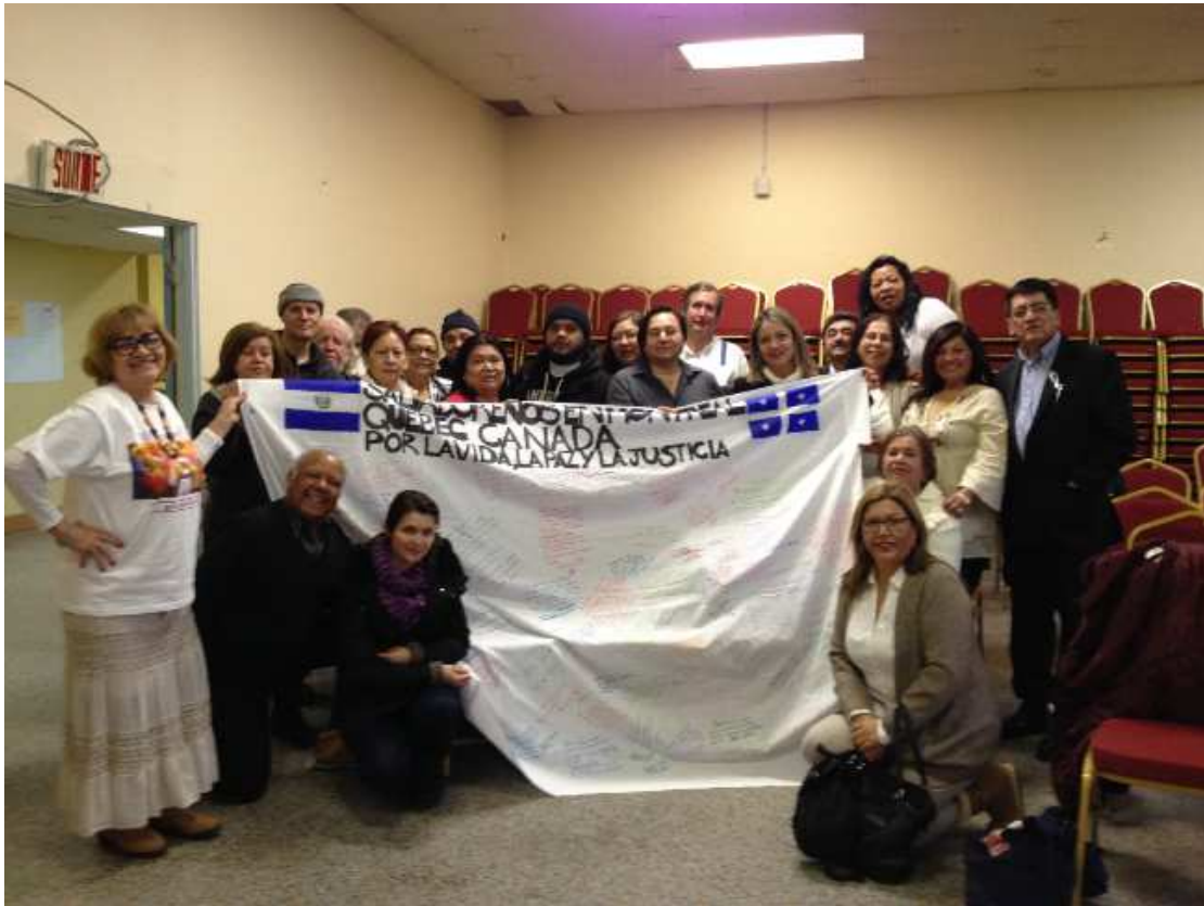
Algunos momentos de la actividad

El día 29 de marzo del presente año, el Viceministro de Relaciones Exteriores, Integración y Promoción Económica, Carlos Castaneda, recibió un reconocimiento por parte de la Asociación de Chalchuapanecos en Montreal.