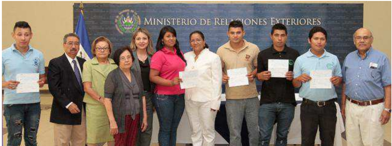
Jóvenes emprendedores salvadoreños recibiendo donativo