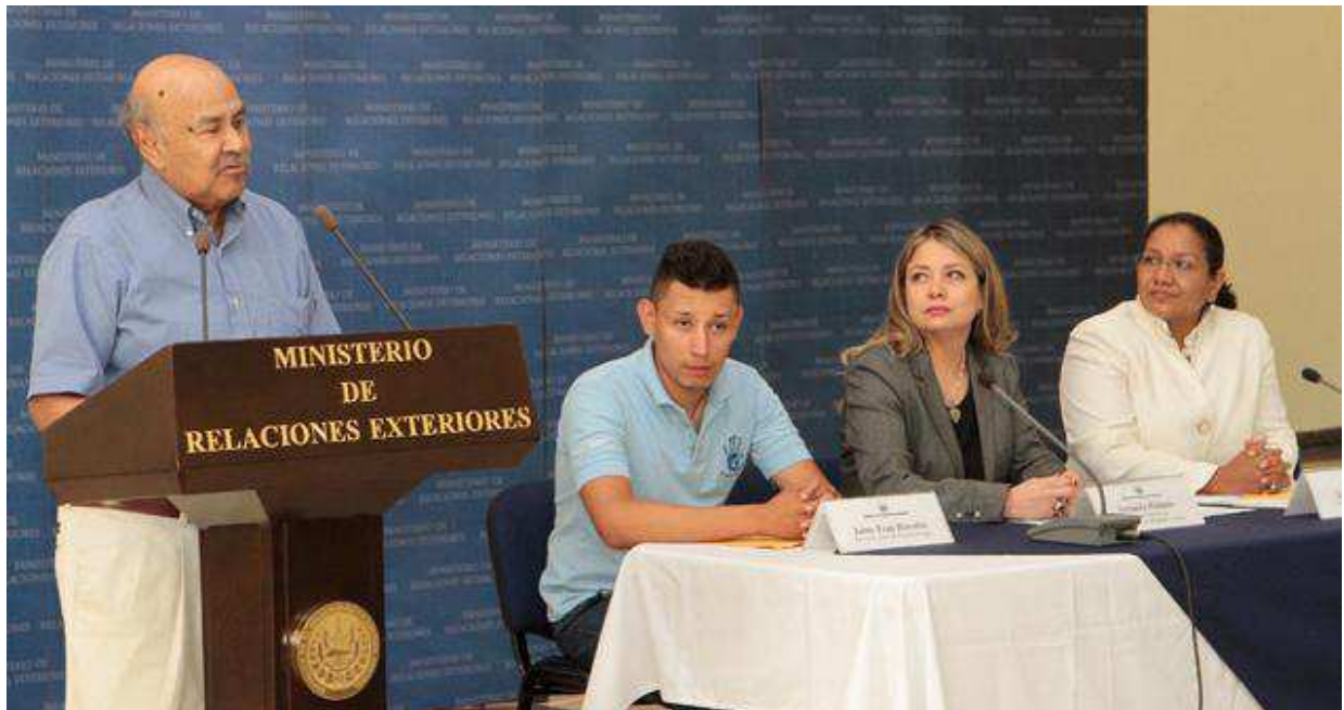
Representante del Comité de Salvadoreños en Montreal reiterando su compromiso por el presente y el futuro de El Salvador.