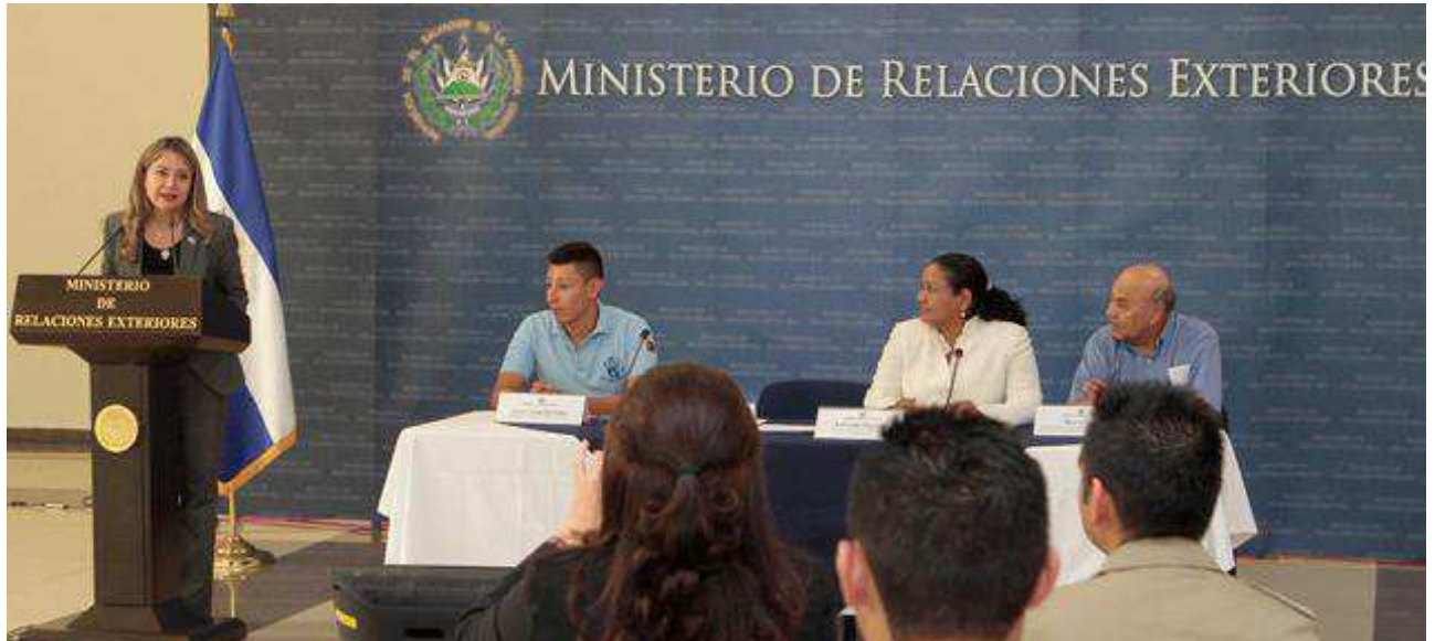
Cónsul General de El Salvador en Montreal, Verónica Pichinte, expresando palabras de agradecimiento a la Comunidad Salvadoreña en Montreal y al Viceministerio para los Salvadoreños en el Exterior por su apuesta en la Juventud salvadoreña.