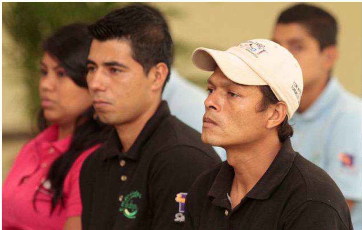
Jóvenes emprendedores asistentes al acto de entrega.