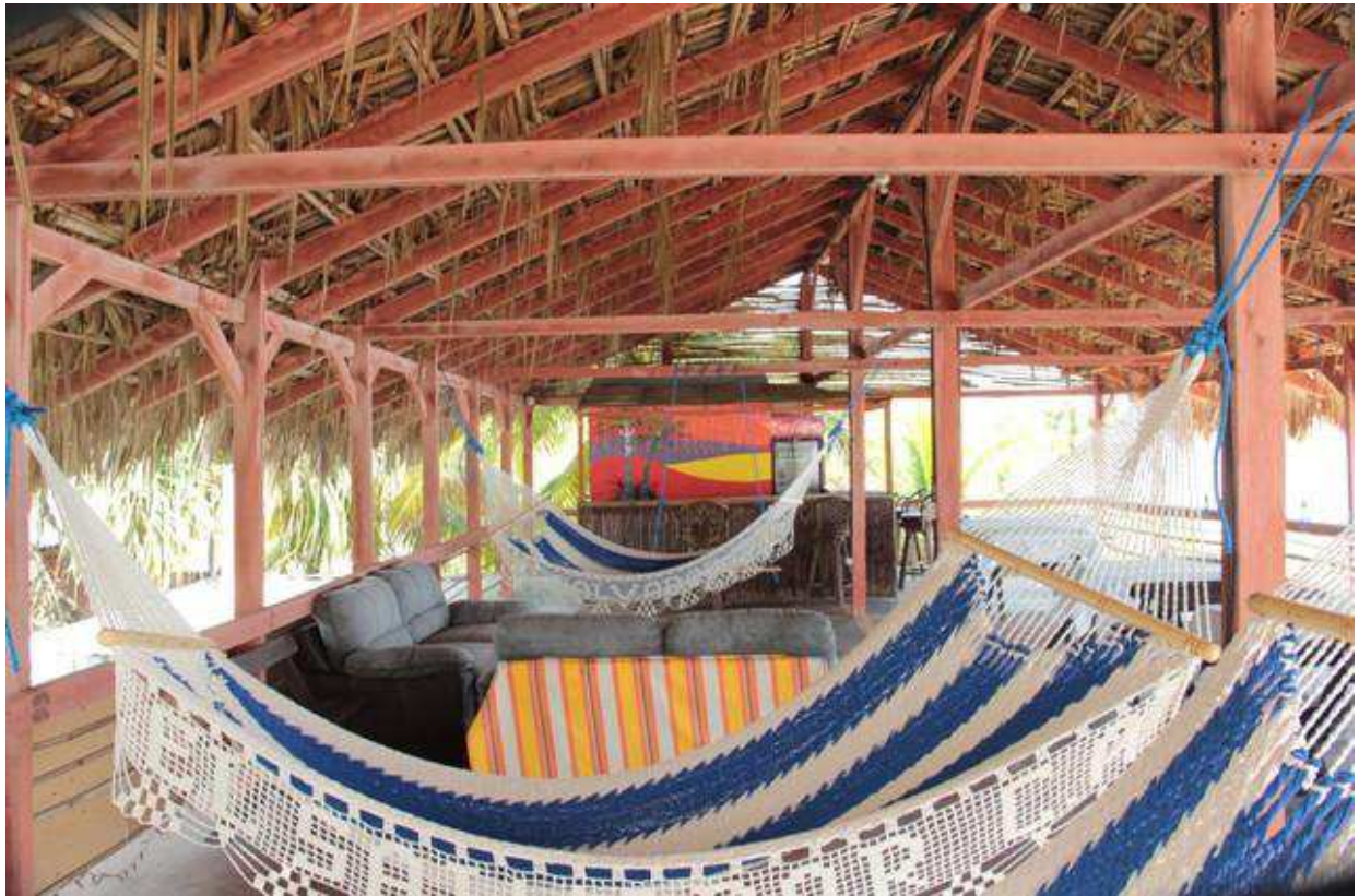
Instalaciones del Hotel Oasis Azul.