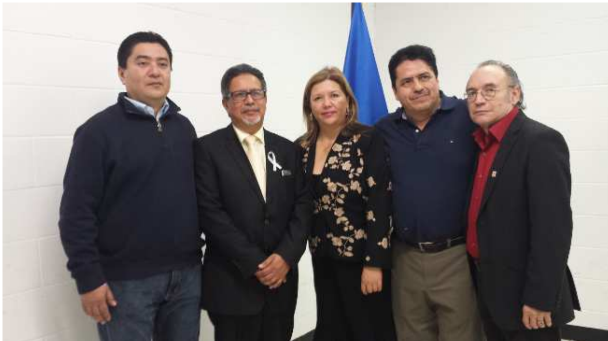
Viceministro Castaneda y la Vicecónsul Contreras con representantes de Organizaciones de salvadoreños.