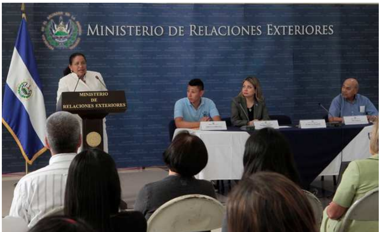
Palabras de la Viceministra para los Salvadoreños en el Exterior y agradecimiento al Comité Ciudadano por las iniciativas en pro de nuestra juventud salvadoreña.