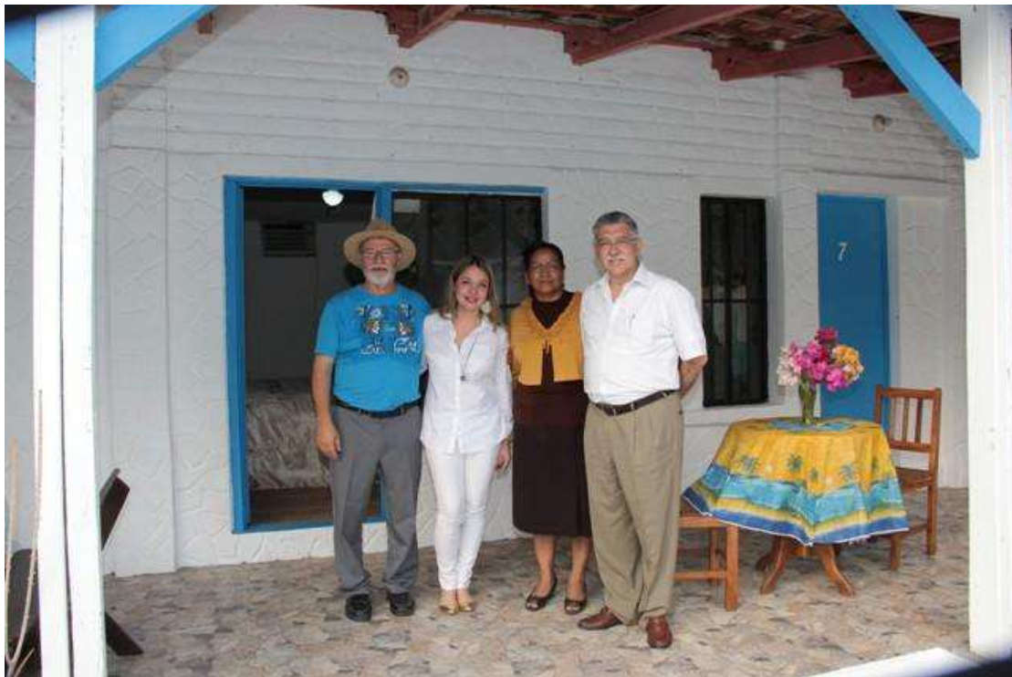
El señor Rossignol junto a invitados especiales: la Cónsul General de El Salvador en Montreal, Licda. Verónica Pichinte, Viceministra para salvadoreños en el Exterior, Licda. Liduvina Magarín y el Ministro de Turismo, Lic. Napoleón Duarte, compartieron las bellas instalaciones del Hotel.