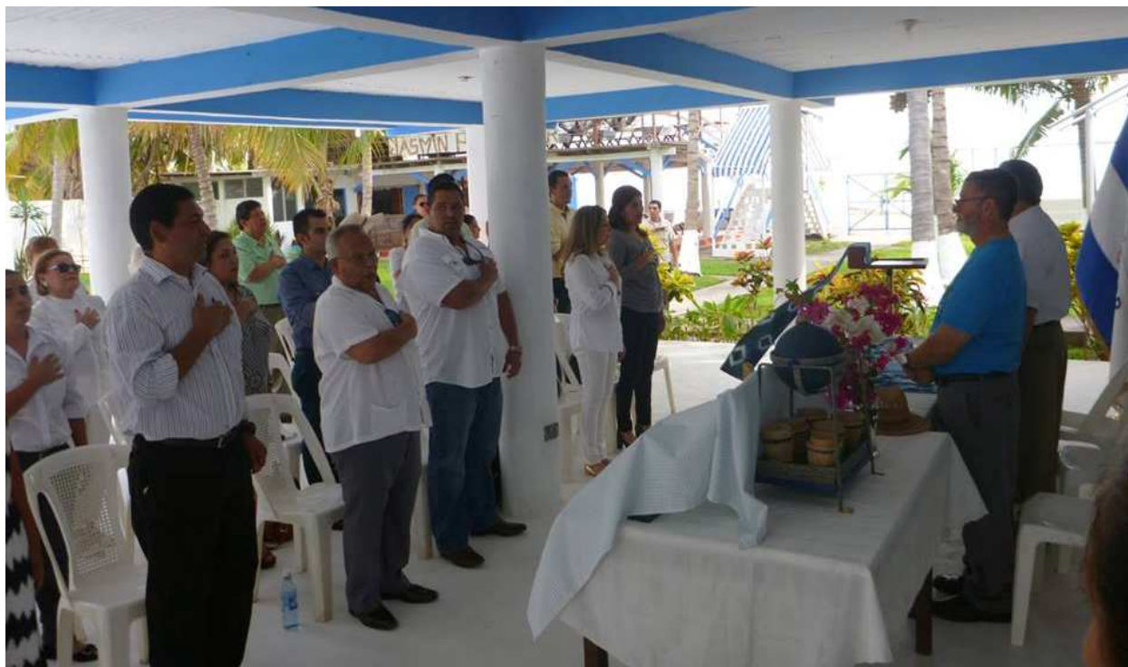
Invitados especiales en el acto de inauguración del Hotel