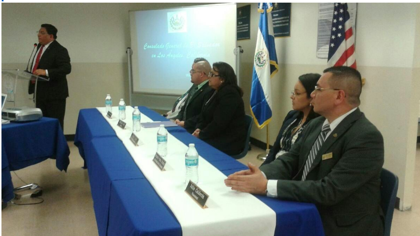
Transferencias de ingresos Por recaudaciones servicios consulares y emisión de DUI